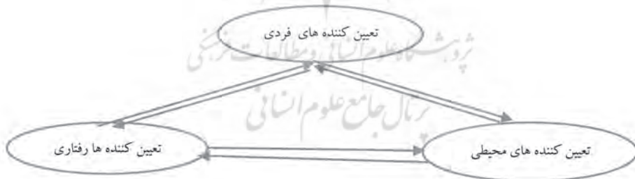
شکل ۱: تئوری شناختی اجتماعی بندورا (۲۰۰۹)

مبنای نظری این پژوهش، تئوری «شناختی- اجتماعی» (بندورا، ۲۰۰۹) (شکل ۱) و مدل نظری «تأثیرپذیری افتراقی رسانه» ۲ است (والکنبرگ و پیتر ۳ ، ۲۰۱۳). تئوری شناختی اجتماعی، یک چارچوب مفهومی عاملی فراهم می سازد که در آن تعیین کننده ها و مکانیسم تأثیر رسانه های جمعی را بر افکار و اعمال انسان توضیح می دهد. رفتار انسان اغلب به صورت روابط علی معلولی یک طرفه توضیح داده می شود. در این قالب ادراکی، رفتار یا توسط تأثیرات محیطی یا به وسیله تمایلات درونی، شکل گرفته و کنترل می شود. تئوری شناختی- اجتماعی، تعامل و عملکرد روانی- اجتماعی را در زمینه علیت متقابل سه گانه توضیح می دهد. در این نگاه تعاملی، خود و جامعه، عوامل فردی (وقایع شناختی، عاطفی و بیولوژیک)، الگوی رفتاری و وقایع محیطی، همه تعیین کننده های تعاملی هستند که به شکل دو طرفه بر هم تأثیر می گذارند.