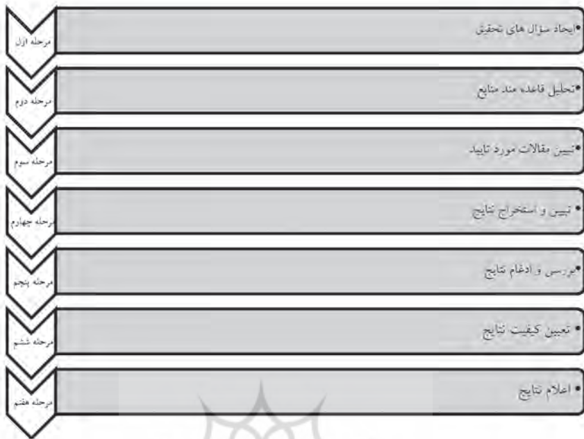
شکل ۱: مراحل پیاده سازی روش فراترکیب

بر اساس شکل ۱، مراحل مبسوط پیاده سازی روش فراترکیب به شرح زیر می باشد: