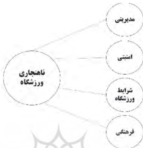
شکل ۱: چارچوب مفهومی پژوهش (اندام و سلیمی، ۱۳۹۶، کارگر و همکاران، ۱۳۹۵ و برجپول و همکاران، ۲۰۱۷)

جم تنها بخشی از اتفاقات لیگ برتر ایران در هفته‌های اولیه بود. لذا پژوهش حاضر به دنبال آن بود تا در ابتدا مولفه‌های بروز ناهنجاری در فضای ورزشگاه‌های فوتبال ایران را شناسایی و در ادامه راهکارهایی برای جلوگیری و کاهش اثرات آن ارائه نماید.