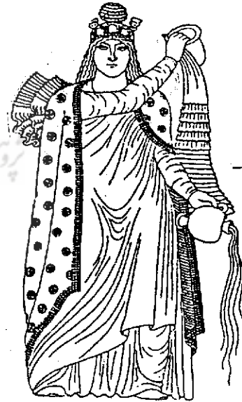
شکل ۷ الف