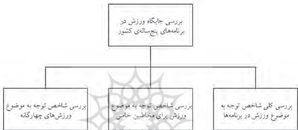
شکل ۱: چگونگی بررسی جایگاه ورزش در برنامه‌های پنج‌ساله با توجه به شاخص توجه

خودباوری معلولان دارد، (یازچیوقلو، ۲۰۱۲؛ رابرتسون و امرسون، ۲۰۱۰) ولی علی‌رغم حضور تعداد زیادی معلول و جانباز در کشور- پس از سپری شدن ۵ برنامه پنج‌ساله- در برنامه ششم به این امر توجه شده است که نشان‌دهنده نبود یک روند توسعه‌ای برای آن می‌باشد. از طرف دیگر، جهت نمونه در سیزدهمین برنامه پنج‌ساله چین (۲۰۱۶ تا ۲۰۲۰) هدف‌گذاری کمی مانند رسیدن به سهم یک درصدی از تولید ناخالص داخلی در صنعت ورزش ایران و یا رسیدن به سرانه ۱/۸ مترمربعی برای فضای ورزشی تدوین شده است (یو و نیکول، ۲۰۱۹) که در سطح برنامه‌ریزی ورزشی در قوانین پنج‌ساله ایران چنین هدف‌گذاری کمی مشاهده نشده است. رویکرد ابتکاری در بررسی جایگاه ورزش در قوانین برنامه‌های پنج‌ساله ایران در شکل ۱ نشان داده شده است: