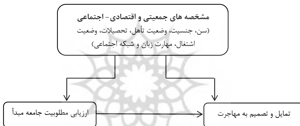
شکل ۱: مدل نظری و تحلیلی تحقیق

باتوجه به نظریات مطرح شده مدل نظری به صورت شکل ۱ ترسیم می شود. این مدل نشان می دهد که تمایل و تصمیم به مهاجرت از یک سو، تحت تأثیر ارزیابی افراد از مطلوبیت جامعه مبدأ است. از سوی دیگر، باتوجه به گزینشی بودن رفتار مهاجرتی آن، به شدت متأثر از مشخصه های جمعیتی، اقتصادی- اجتماعی افراد است.