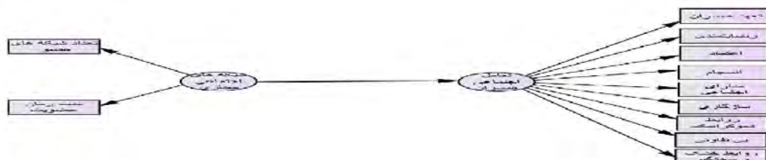
نمودار ۱: مدل نظری تحقیق