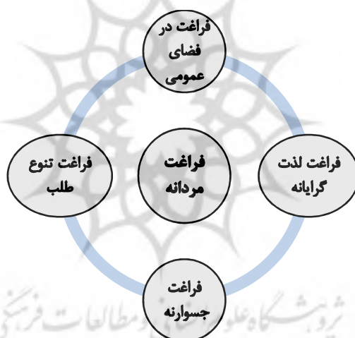
شکل ۱: برساخت فراغت مردانه به میانجی چهار مفهوم اساسی

فراغت مردانه، فراغتی است که این خصلت ها را داراست: فراغت در فضای عمومی، فراغت لذت گرایانه، فراغت جسورانه، فراغت فعالانه. در حقیقت، این ویژگی ها در کنار یکدیگر فراغت مردانه را در میدان مطالعه می سازند.