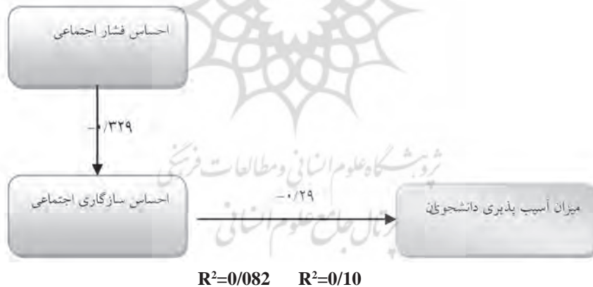
مدل ۳: مسیر تأثیر گذاری متغیرهای مستقل معنادار در دومین معادله رگرسیونی بر متغیر وابسته

از مدل فوق می توان استنباط کرد که متغیر مستقل احساس فشار اجتماعی با متغیر وابسته تحقیق یعنی میزان آسیب پذیری دانشجویان به طور مستقیم ارتباط معنادار آماری ندارد، بلکه اثر آن غیر مستقیم و از طریق متغیر مستقل احساس سازگاری اجتماعی است. نمودار نشان می دهد که رابطه دو متغیر منفی است. از سوی دیگر، از بین دو متغیر مستقل تحقیق، متغیر احساس سازگاری اجتماعی دارای رابطه مستقیم با متغیر وابسته می باشد که یک رابطه منفی است.