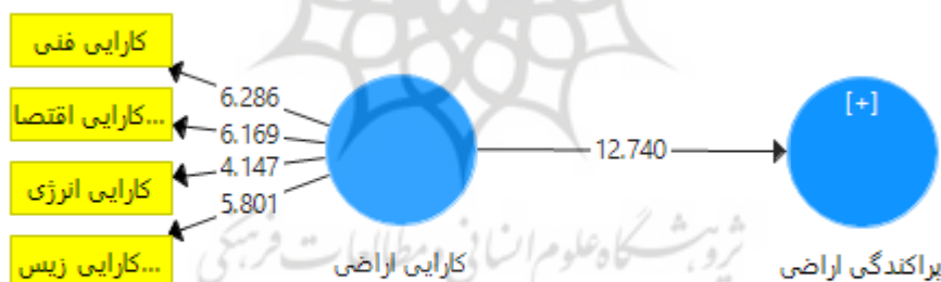
نمودار ۱: مقادیر آماره تی (t) مدل تحقیق

نمودار ۱: مقادیر آماره تی (t) مدل تحقیق: با توجه به یافته‌های نمودار ۱ مقادیر آماره t برای همه متغیرها و زیر مولفه‌ها بالاتر از ۱/۹۶ می‌باشد لذا معناداری همه متغیرها و زیر مولفه‌های پژوهش در سطح ۰/۰۵ اطمینان تایید می‌شود.