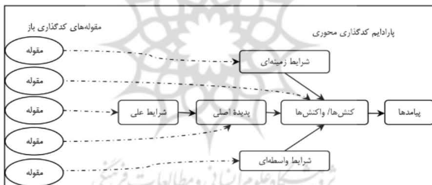
شکل ۱. مدل پارادایمی نظریه داده بنیاد استراوس و کوربین

بکارگرفته شده جهت تحقق اهداف این پژوهش، روش نظریه داده بنیاد ۱ است که نوعی تحلیل مقایسه‌ای داده‌ها است و از آن به عنوان «مقایسه مستمر»، نیز یاد می‌شود. بر این اساس تولید طبقه‌ها و ایجاد ارتباط بین آنها از طریق مقایسه بین رویدادها با یکدیگر، حاصل می‌شود. طرح استفاده شده در این پژوهش براساس طرح نظام‌مند استراوس و کوربین ۲ (۱۹۹۰)، است. ابزار اصلی گردآوری داده‌ها در این پژوهش مصاحبه عمیق و نیمه ساختاریافته (با سوالات باز) است. بر این مبنای پژوهش با این پرسش که «راهبرد مناسب جهت زنجیره تامین ارزش آفرین چیست؟»، آغاز و با مصاحبه‌های متعددی که از افراد خبره، با تجربه و صاحب نظر در زمینه راهبردهای توسعه محصولات جدید عمل می‌آید، ادامه می‌یابد. جامعه آماری این مطالعه متشکل است ۱۵ تن از خبرگان دانشگاهی، مدیران و کارشناسان ارشد مدیریت صنعتی و بازرگانی که در زمینه توسعه محصولات، مطالعات و تجارب ارزنده ای دارند و از اطلاعات کافی در زمینه پژوهش برخوردارند. همچنین در این مطالعه نمونه‌گیری به دو شیوه‌ی هدفمند (انتخاب گروه هدف اطلاع رسانی در مورد پدیده‌ی مورد مطالعه) و نظری (ادامه مصاحبه تا رسیدن به کفایت نظری) انجام گردید. روش تحلیل بکار گرفته شده در این مطالعه، طی سه مرحله کدگذاری اولیه (باز)، کدگذاری ثانویه (شکل‌دهی طبقه‌های فرعی) و کدگذاری انتخابی (گزینشی)، انجام و مدل پژوهش احصاء شده است.