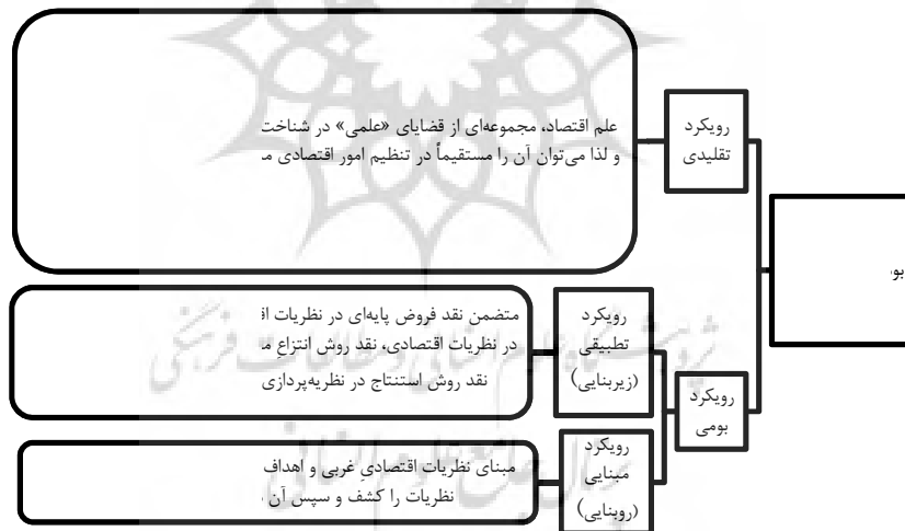
شکل ۲: رویکردهای بومی‌سازی اقتصاد رایج از منظر اقتصاد اسلامی؛ منبع: (درخشان ۱۳۹۱: ۳۴-۳۵).

و یا عده‌ای تنها با تأکید بر رویکردهای بومی‌سازی به اقتصاد رایج از منظر اقتصاد اسلامی، رویکردهای مواجهه با اقتصاد رایج را در وهله نخست به رویکرد تقلیدی و رویکرد بومی تقسیم کرده و رویکرد بومی را در قالب دو دسته رویکرد تطبیقی (روبنایی) و رویکرد مبنایی (زیربنایی) تقسیم نموده‌اند (به عنوان نمونه و برای درک توضیحات بیشتر رجوع کنید به شکل ۲).