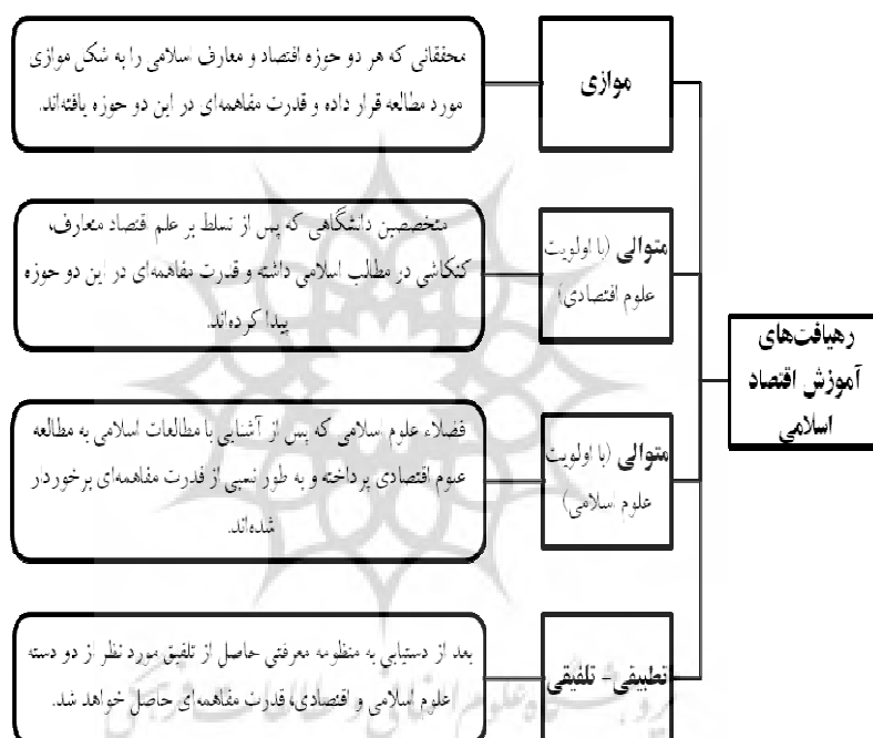
شکل 3: چهار رهیافت آموزش اقتصاد اسلامی در حال حاضر (منبع: مصاحبه‌شونده ۸)

بر اساس آنچه در شکل 3 توضیح داده شد، می‌توان زیرطبقات، کدهای باز و واحدهای معنایی مرتبط با هر یک از رهیافت‌های متفاوت بین‌رشته‌ای در ارائه دوره (به عنوان طبقه) را در جدول 4 مشاهده کرد. در این جدول به نوعی به ارزیابی نظر طرفداران هر یک از این رهیافت‌ها پرداخته‌ایم.