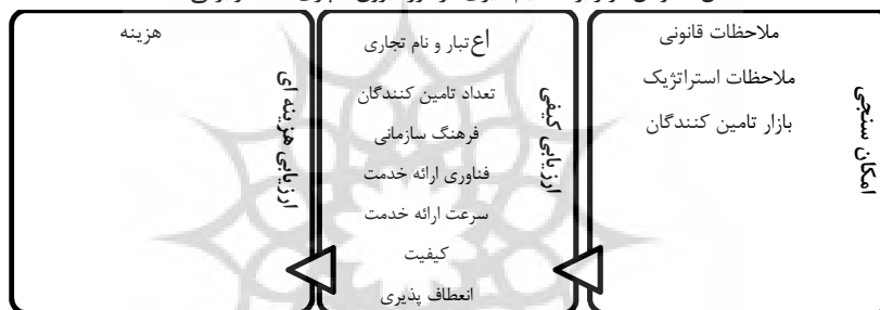
شکل ۱: عوامل موثر بر تصمیم‌گیری در مورد برون‌سپاری (الف و براتی ۱۳۹۱)

در سال ۱۳۹۱ الف و براتی مدلی برای تصمیم برون‌سپاری در بانک صنعت و معدن ارائه کردند. به منظور طراحی مدل از مطالعه ادبیات، پیمایش مبتنی بر تجربیات، نظر سنجی و برای تجزیه و تحلیل اطلاعات از فرایند تحلیل سلسله مراتبی استفاده شده است. در مدل ارائه شده نخست امکان‌پذیری برون‌سپاری فعالیت با توجه به قوانین و مقررات موجود، ملاحظات استراتژیک سازمان (ماموریت، توانمندی محوری، امنیت اطلاعات، وابستگی میان فعالیت ها و ماهیت سیاست گذاری و تصمیم‌گیری) و وجود تامین‌کنندگان توانمند بررسی می‌شود. در صورتی که امکان برون‌سپاری فعالیت وجود داشته باشد، میزان مناسب بودن برون‌سپاری فعالیت با توجه به ابعاد کیفی و هزینه‌ای ارزیابی می‌گردد. به این ترتیب سه شاخص برای ارزیابی تصمیم برون‌سپاری محاسبه می‌شود: شاخص امکان‌پذیری، شاخص تناسب کیفی، شاخص تناسب هزینه‌ای. این مدل در مورد ارزیابی تصمیم‌تأمین و پشتیبانی دستگاه‌های خودپرداز بکار گرفته شد. نتایج حاکی از توصیه به برون‌سپاری از هر سه منظر است.