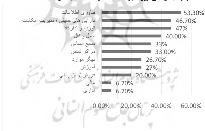
نمودار ۲: پیش‌بینی برون سپاری خدمات در بانک‌های لهستان (Radlo 2011)

در سال ۲۰۱۲ نیز شرکت AT Kearney به آینده بانکداری اسلامی پرداخته است. در این گزارش آمده است که در حال حاضر سودآوری بانکداری اسلامی نسبت به بانکداری متعارف کمتر