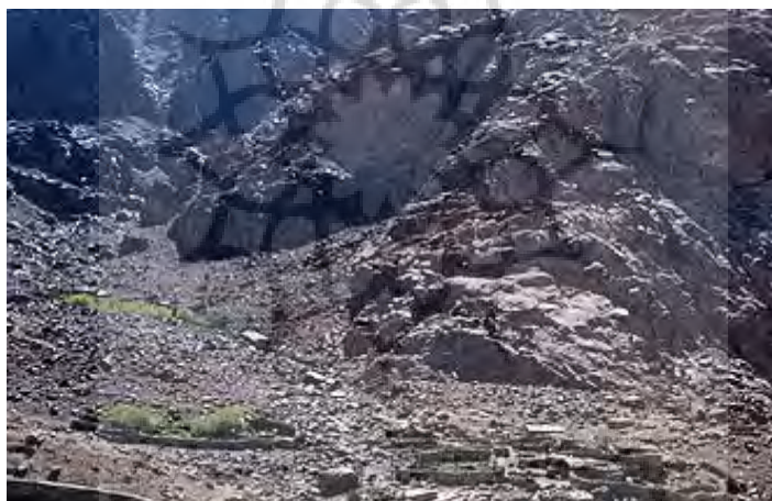
شکل ۴: مصر، سینا، سنت کاترین، وادی لجا، بیشه‌های زیتون

http://www.soniahalliday.com/category-view3.php?pri=EG13A-0-99JT.jpg