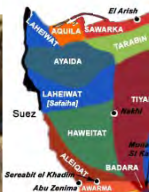
شکل ۳: نام و محل قبایل موجود در صحرای سینا و بدویان صحرای سینا