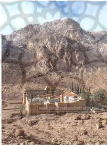
شکل ۶: صومعه سنت کاترین در پای کوه سینا

http://discoversinai.net/english/tourist-information/sinai-maps