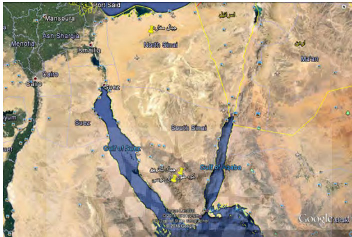
شکل ۱: جایگاه کوههای مغاره، کاترین، سینا، سینای شمالی و سینای جنوبی (google.e)