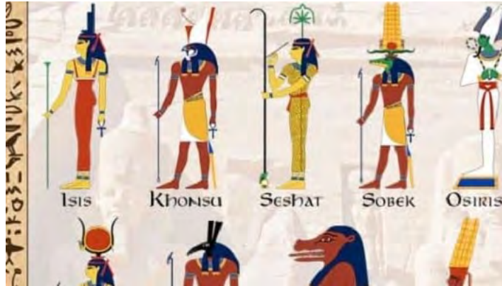
شکل ۷: خدایان مصری که هیبتی شبیه به انسان با سر حیوان (معمولاً شغال، میمون یا سگ) داشتند