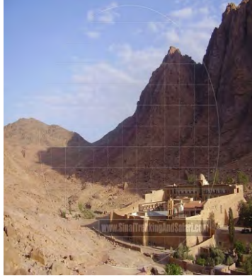
شکل ۵: صومعه سنت کاترین در پای کوه سینا، ساخته شده در قرن شش میلادی

http://discoversinai.net/english/tourist-information/sinai-maps