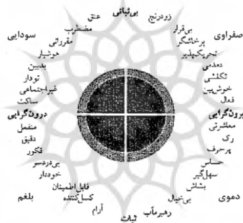
نمودار 2: تبیین رابطه گونه‌های مزاجی در کنار صفات شخصیتی و ویژگی‌های رفتاری از دیدگاه آیزنک (همان)

در رویکرد تحلیل عاملی، هانس آیزنک با تحقیقات آزمایشی و تجربی دامنه‌دارش به تبیین صفات شخصیتی درونگرایی - برونگرایی و تهییج‌پذیری - ثبات عاطفی در تناسب با چهار مزاج پرداخت (آیزنک و آیزنک، 1985) (نمودار 2). علاوه بر این، آیزنک به توضیح پایه‌های ژنتیکی، ساختار مغز و سیستم‌های عصبی در ارتباط با دو فاکتور شخصیتی درونگرایی - برونگرایی و تهییج‌پذیری پرداخته است.