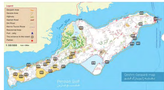
تصویر ۱- نقشه ژئوپارک جهانی قشم

ستارگان و فعالیت بانوان روستا در تولید صنایع دستی به توسعه صنعت گردشگری در این روستا کمک زیادی کرده است. تعاونی صنایع دستی موجود در روستا در سال ۲۰۱۴ و با کمک دفتر برنامه کمک‌های کوچک سازمان ملل (SGP) شکل گرفته است و در حال حاضر ۳۰ نفر از زنان روستا به طور مستقیم عضو این تعاونی هستند و به تولید صنایع دستی بومی و فروش آن به گردشگران می‌پردازند.