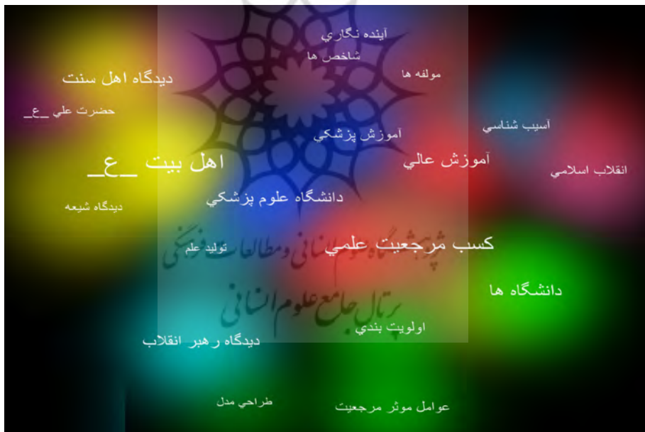
شکل ۱. خوشه‌بندی دانش کارآفرینی در ایران با استفاده از نرم‌افزار «ووس‌ویور»

در ادامه، نتایج مربوط به تحلیل دانش حوزه به‌منظور شناسایی الگوی رایج ارتباطات مفهومی در مدارک مورد بررسی و درک کلی از موضوع‌های حاکم بر آن‌ها، خوشه‌های مفهومی حوزه مرجعیت علمی بر اساس پژوهش‌های آن مورد بررسی قرار گرفت و شناسایی شد. در شکل ۱، نتایج خوشه‌بندی به‌خوبی مشاهده می‌شود.