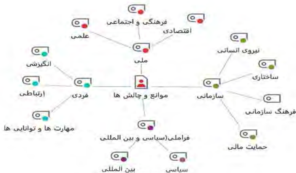
شکل ۱: مدل مفهومی موانع تعاملات بین‌المللی اعضای هیأت علمی (برگرفته از پژوهش ترسلی، قاسم‌زاده و یار محمدزاده ۱۴۰۱)