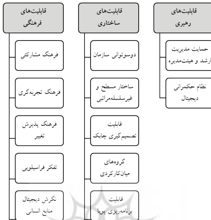
شکل ۴: قابلیت های سازمانی پشتیبان شکل دهی استراتژی تحول دیجیتال

دارد و نزدیکی آن به صفر نشانگر توافق کمتر بین دو کدگذار است. به این منظور در پژوهش حاضر برای کنترل کدها و مضامین استخراج شده از دو کدگذار مستقل استفاده شد و کدهای استخراجی پژوهشگران با نظر یک خبره قیاس شد. همان طور که پیش تر در جداول ۵ الی ۷ اشاره شد، محققان پژوهش حاضر ۸۱ کد متفاوت از مقالات منتخب را شناسایی کردند. کدگذار مستقل دوم پس از بررسی مقالات ۸۰ کد شناسایی کرد که از میان آن ها ۷۶ کد با کدهای محققان مشترک است. بر این اساس شاخص هولستی طبق رابطه زیر در پژوهش حاضر ۰/۹۴ محاسبه شده است که طبق آن پایایی مناسب نتایج پژوهش نشان داده می شود.