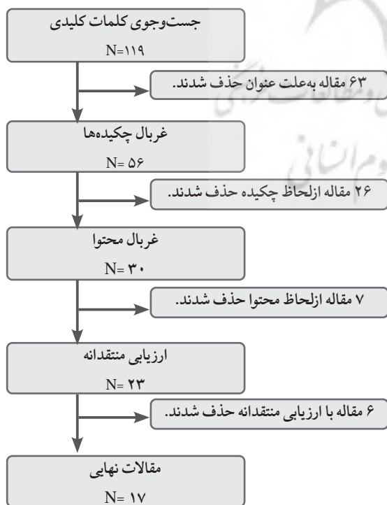
شکل ۲: خلاصه ای از نتایج جست و جو و انتخاب مقاله های مناسب

بر اساس ساختار امتیاز بندی اشاره شده، مقالات بر پایه درجه کیفی دسته بندی شدند. در این پژوهش حداقل امتیاز لازم برای پذیرش پژوهشی ۳۰ در نظر گرفته شده است.