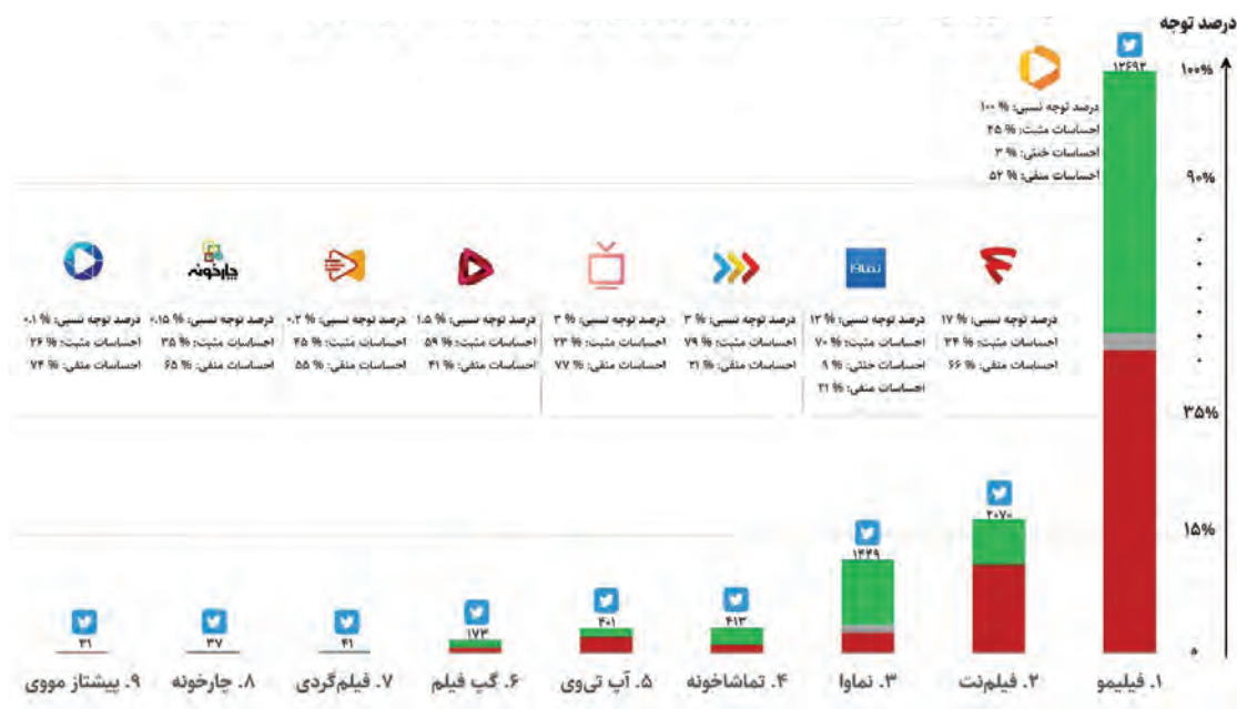
نمودار ۳: درصد توجه و تحلیل احساسات کاربران توئیتر فارسی به رسانه‌های نمایشی ایرانی