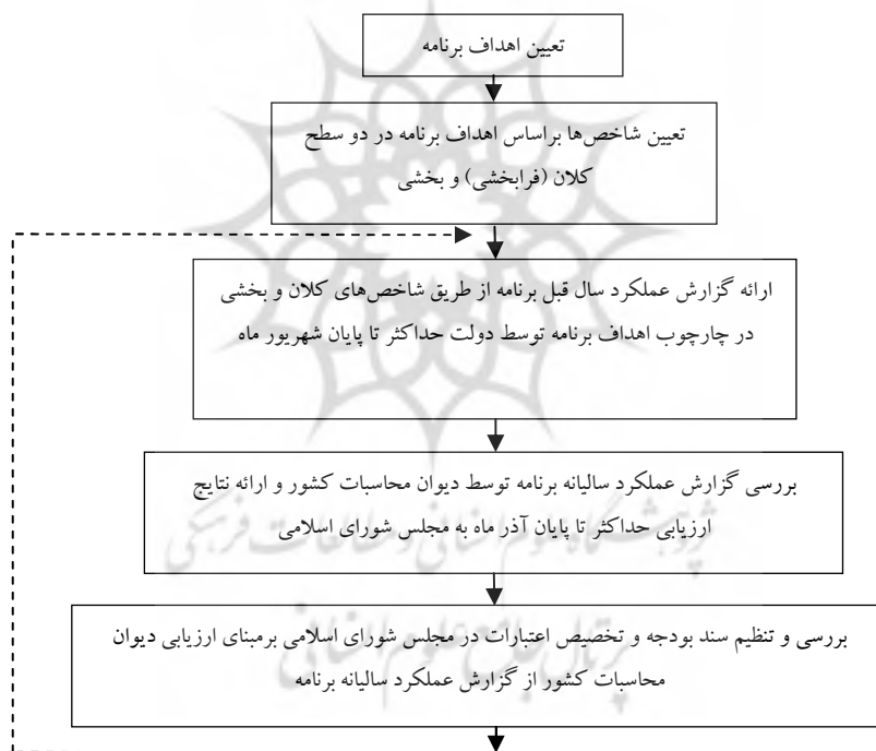
شکل ۲ سازوکار پیشنهادی نظارت بر برنامه پنجم توسعه

بودجه سال آتی قرار گیرد، امکان نظارت مؤثر مجلس شورای اسلامی بر برنامه فراهم می‌شود. بر این اساس لازم است تا پس از مشخص شدن اهداف برنامه؛ شاخص‌هایی که اهداف برنامه را نمایندگی می‌کنند در دو سطح کلان (فرابخشی) و بخشی تهیه شوند، و دولت نیز موظف شود گزارش عملکرد سالیانه برنامه را براساس شاخص‌های مذکور حداکثر تا پایان شهریور ماه سال بعد ارائه کند. همچنین باید دیوان محاسبات کشور پس از بررسی گزارش عملکرد، ارزیابی خود از گزارش ارائه‌شده از سوی دولت را ظرف مدت معین (پس از سه ماه) به مجلس شورای اسلامی تقدیم کند. مجلس شورای اسلامی هم براساس گزارش دیوان محاسبات کشور، بودجه سال آتی را بررسی و تصویب نماید. این سازوکار در شکل ۲ نشان داده شده است.