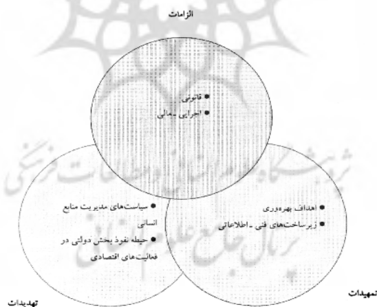
شکل ۲ مدل مفهومی تحقیق (متشکل از مؤلفه‌های سه‌گانه و اجزای اصلی تشکیل‌دهنده هر مؤلفه)