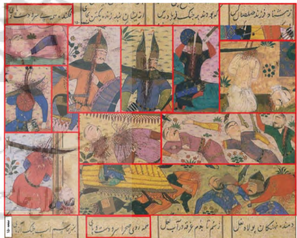
تصویر ۵. مثله‌گری در خاوران‌نامه. مأخذ: (حبیب‌اللهی، ۱۳۹۷، ۷۵)