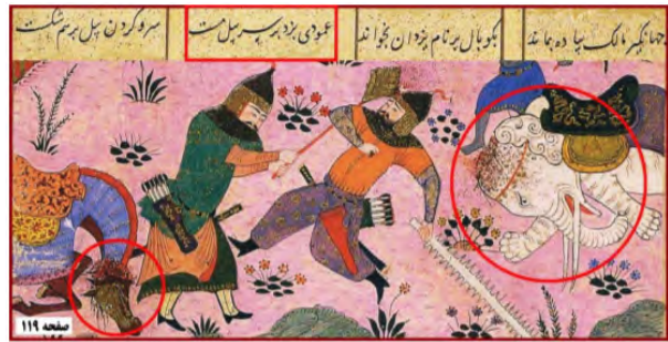
تصویر ۳. کشتار حیوانات. مأخذ: (خوسفی، ۱۳۸۱، ۱۱۹)

باتوجه به تأکید فوکو به بر درهم تنیدگی قدرت/دانش، که نه تنها به علت گفتمانی بودن دانش‌ها و شکل گرفتن گفتمان‌ها بواسطه‌ی قدرت، است، بلکه گفتمان‌ها مولد هستند و با اتکاء به مفروض‌ها و ادعاهایی که دانش آن‌ها حقیقی است، با کمک زمینه‌هایی ادعای حقیقت می‌کنند. فوکو این را به عنوان رژیم حقیقت مطرح کرده است (رز، ۱۳۹۷، ۲۶۱). بادقت در جزئیات تاریخی می‌توان بیان کرد که این مفهوم از قهرمان و نمایش این گونه از حضرت (ع) یک حقیقت برساخته‌ی تاریخی است. لذا در ابتدای امر با کمک تصاویر موجود به کشف این ویژگی‌های شخصیته‌ی که از حضرت علی (ع) نمایان شده است، پرداخته شد و از توصیف تصاویر به عناوینی مانند: بدرفتاری با اسیران، روحیه‌ی تجاوزگری، شکنجه‌های وحشتناک، زجرکشی، انبوه کشتار انسان‌ها، کشتار حیوانات و تحمیل دین اسلام دریافت گردید. در مواجهه با متن خاوران‌نامه نیز مغایرت‌هایی وجود دارد که از توصیف‌های اولیه آن‌ها به ویژگی بی‌رحمی و سنگدلی، برآشفتگی و عصبانیت، آغازگری جنگ‌ها از خصوصیات حضرت علی (ع) در نسخه خاوران‌نامه برشمرده شد. حال در تمام تصاویر با این مضامین، تصویرگر، صورت‌بندی چهره علی (ع) را بطور کاملاً ملموس ترسیم کرده است؛ نمادهایی مانند: هاله‌ای طلایی دور سر، شمشیر دوزبانه (ذوالفقار) و همچنین اسب مخصوص ایشان بنام دولدل، بهره گرفته است تا بیننده در اولین نگاه به سوزده اصلی داستان رهنمون شود. در گفتمان سیاسی، مفهوم قدرت طلبی و خشونت را می‌توان در انبوه کشتارهای خانوادگی که در میان خاندان‌های تیموری و ترکمانی اتفاق افتاد می‌توان مشاهده کرد. در گفتمان مذهبی، مفاهیمی