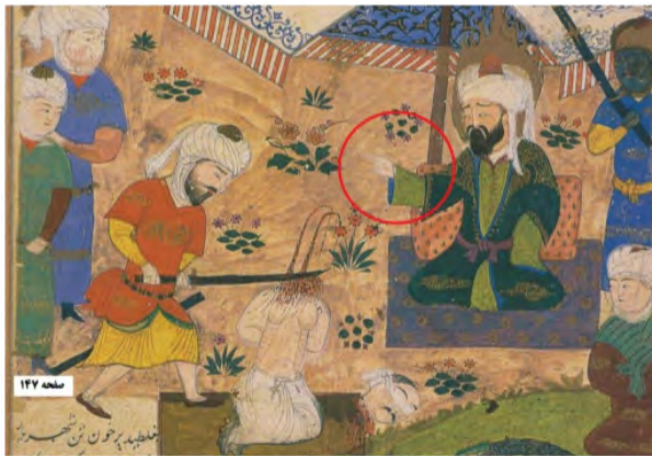
تصویر ۷. تحمیل دین اسلام. مأخذ: (خوسفی، ۱۳۸۱، ۱۴۷)

رهبران‌شان، این ادعا دیده شده است (ادعای اینکه روح علی در رهبر این فرقه حلول کرده و برای کشورگشایی و نیت‌های دنیا طلبانه‌ی خویش، خود را علی می‌نامید). از تصویری‌سازی های نسخه خاوران‌نامه در فرهنگ غیر ایرانی و غیر شیعی، از شخصیت علی (ع) به‌عنوان یک فرد متخاصم و جنگ طلب تلقی می‌گردد. همچنین در نگاه مخاطب ایرانی و شیعی نیز این پرسش مطرح می‌گردد که علت تغییر چیست؟ رژیم حقیقت در این گفتمان چگونه عمل کرده است؟ که سبب این گونه نشان دادن حضرت علی (ع) در متن و تصاویر خاوران‌نامه شده است. زیرا مفهوم قهرمان و پهلوان در فرهنگ ایرانی به گونه‌ای کاملاً متضاد با این مفهوم نوساخته است.