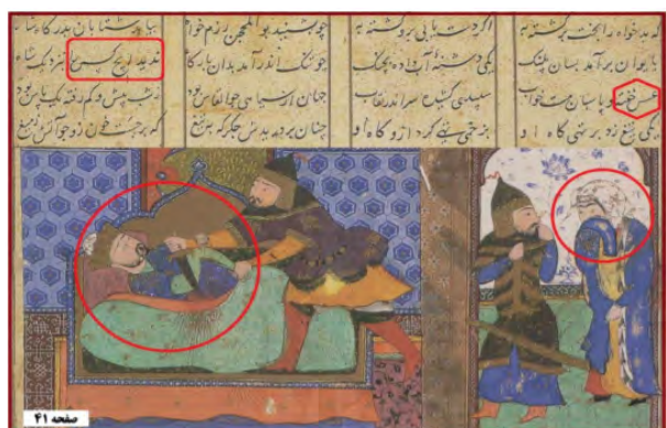
تصویر ۶. قتل غافلگیرانه نوادر. مأخذ: (خوسفی، ۱۳۸۱، ۴۱)