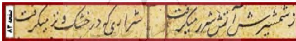
تصویر ۱. متن اشعار خاوران‌نامه.

تصاویر موجود در این نسخه شامل ۱۱۵ برگ است، در این میان تعداد ۸۱ تصویر مربوط به جنگ‌های حضرت (ع) و تعداد ۳۴ تصویر مربوط به سایر موضوعات اختصاص دارد. به‌طور تقریبی ۷۰ درصد از تصاویر کتاب خاوران‌نامه محتوای کشتار و خونریزی دارد. حبیب‌اللهی به وجود تناقضات تصویری اشاره می‌کند. هنرمند نقاش به تصویرسازی تعارضات با چهره حقیقی حضرت (ع) در متن نهج‌البلاغه و متن خاوران‌نامه می‌پردازد مانند: تجاوزگری، مثله‌سازی، زجرکشی، قتل غافلگیرانه، کشتار انسان‌ها و حیوانات و اجبار در تحمیل اسلام؛ نسبت دادن هر یک از این صفات ناپسندیده به حضرت علی (ع) کافی است که تعلق این مثنوی به هنر مصطلح شیعی را زیر سؤال ببرد. در آثار الباقیه اثر ابوریحان بیرونی در ۱۱۸