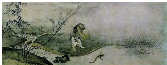
تصویر ۳. صید گربه ماهی با کدو، اوایل قرن ۱۵، جوستسو، جوهر و رنگ روی کاغذ، موزه ملی کیوتو.