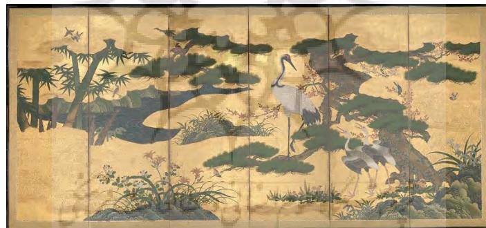
تصویر ۵. پرندگان و گل‌های چهارفصل، هنرمند ناشناس ژاپنی، جوهر، رنگ و ورق طلا روی کاغذ، اواخر قرن ۱۶.