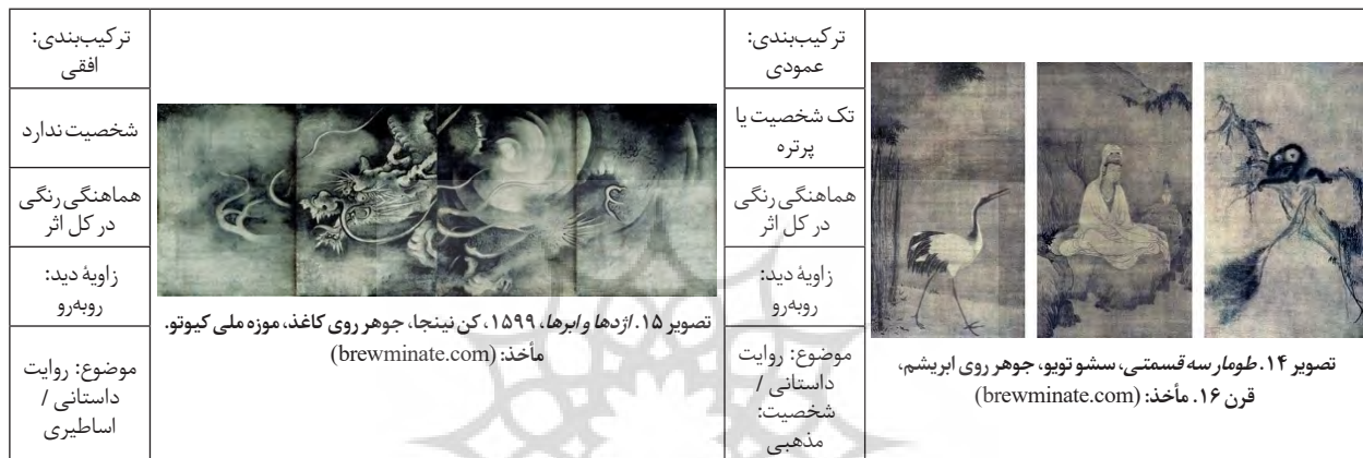
جدول ۲. مقایسه ویژگی‌های هنر ذن ژاپن و ویژگی‌های نقاشی دوره آشیکاگا

تعداد شخصیت‌های زیاد وجود دارد. در بقیه موارد، موضوعات منظره و طبیعت (۵۳ درصد) یا حیوانات (۴۶ درصد) را شامل می‌شوند. افزایش علاقه نسبت به موضوعات طبیعی و حیوانات، به کاهش روایت انسانی و داستانی منجر شده است. البته در معدود موارد، روایت با موضوع مذهبی نیز دیده می‌شود. به دلیل کاهش روایت داستانی، تقریباً در تمامی موارد، زاویه دید از روبه‌رو است. این زاویه، برای ترسیم حیوانات و موضوعات طبیعی که در زوایای بسته‌ای هستند، بهترین زاویه محسوب می‌شود. کاهش علاقه به موضوعات مذهبی را می‌توان در میزان فراوانی انواع شخصیت‌های انسانی نیز مشاهده کرد. بدین ترتیب، بیشتر از شخصیت‌های معمولی در این آثار استفاده شده است. جدول (۲)، ویژگی‌های ذن و نقاشی آشیکاگا در کنار هم نشان می‌دهد.