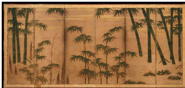
تصویر ۶. بامبو در اثر چهار فصل، توسا میتسانوبو، جوهر، رنگ و ورق طلا روی کاغذ، اوایل قرن ۱۶.