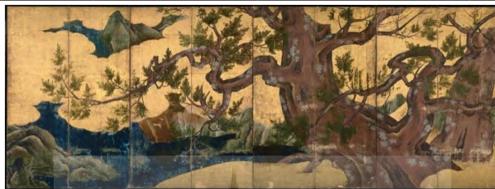
تصویر ۴. نقاشی هشت‌لته‌ای درختان سرو، کانو ایتوکو، جوهر، رنگ و ورق طلا روی کاغذ، با ابعاد ۱۷۴/۶۱ (متر)، موزه ملی توکیو، مأخذ: (upload.wikimedia.org)

نقاشی‌های بعدی است. تصاویر (۴-۵)، مربوط به نقاشی طبیعت است. رنگ‌های درخشان، طرح‌های جوهر قوی، پس‌زمینه ورق طلا و انبوه عناصر تصویری، نمونه‌ای از فرمول تزئینی است که توسط کانو موتونوبو (۱۴۷۶-۱۵۵۹)، بنیان‌گذار مکتب کانو، ایجاد شد. ابعاد اغراق‌آمیز درختان کاج و سرو، تلاش برای ایجاد فضایی برای برجسته‌کردن شاخه‌ها در ترکیبی شلوغ و به‌تصویر کشیدن پرچین‌های چوب است. این پرده‌ها در عظمت ظریف خود، منعکس‌کننده فضای مجللی هستند که در عمارت‌ها و معابد پایتخت وجود داشته است. ترکیب فضای مجلل در بستر طبیعت و زندگی واقعی، بیان‌گر وحدت میان انرژی‌های معنوی و تجربه