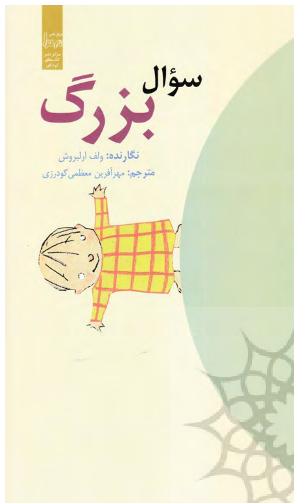
تصویر ۱. طرح روی جلد سؤال بزرگ.

(خرده‌تصویرها و پس‌زمینه) نیز می‌شود. در همین راستا، ابتدا لنگر نوشتاری صفت «بزرگ» باعث تفسیر خرده‌تصویر «گشودگی دستان کودک» می‌شود (یعنی مخاطب متوجه می‌شود که کودک دارد با دست، بزرگی چیزی را نشان می‌دهد)؛ سپس این تفسیر باعث کشف ارتباط سایر اجزای تصویر روی جلد می‌شود (تصویر ۱). یعنی ارتباط تصویر کودک (که با دست، بزرگی یک چیزی را نشان می‌دهد) با کره‌ای که روی آن ایستاده نیز رمزگشایی می‌شود. بزرگی سؤال کودکی که شخصیت اصلی داستان است به دنیای بزرگی که روی آن ایستاده چه ربطی دارد؟ فهم طرح روی جلد، چیزی جز کشف برهم‌کنش اجزای تصویر و نوشتار روی جلد نیست. وظیفه طرح روی جلد هر کتابی، بازنمایی نسبی فضای موضوعی کتاب است. یک طرح جلد هنری، فضای نسبی داستان را نشان می‌دهد اما بازگشایی کدهای تفسیری آن را به پس از خواندن کتاب احاله می‌دهد. طرح روی جلد کتاب مذکور قبل از خوانش داستان، خبر می‌دهد از درونمایه فلسفی یک سؤال درباره رابطه انسان با کره هستی. بر اساس داستانی که در کتاب آمده است، شخصیت اصلی داستان مدام از این و آن می‌پرسد که چرا به این دنیای بزرگ پا گذاشته‌ایم؟ بنابراین پس از خواندن کتاب، علت تضاد بین کره بزرگ زیر پای کودک و کوچکی بچه‌ای که بزرگی سؤال فلسفی اش را با دست