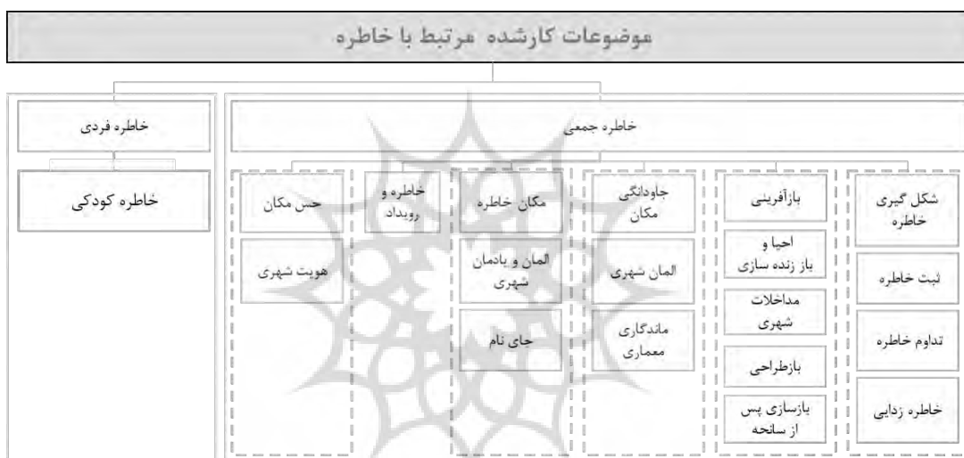
نمودار شماره ۳: موضوعات و اهداف کارشده مرتبط با موضوع خاطره

شده است. در سایر مطالعات، تعدادی مؤلفه انتخاب و در بستر مورد نظر بر مبنای سایر متغیرها، بررسی شده است.