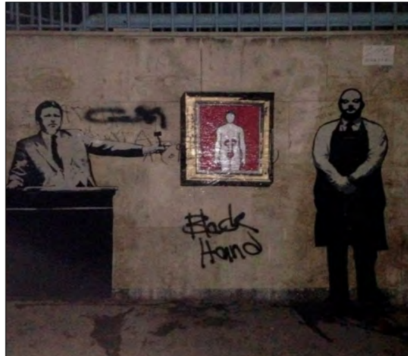
تصویر ۱- اثر بلک‌هند (ماخذ: صفحه فیسبوک هنرمند)