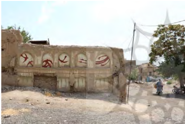
تصویر ۲۰- نمایشگاه بی همه چیز، اثر میرزا حمید (ماخذ: meidaan.com) Image 19: Artwork by Mirza Hamid (Source: Chelcheragh website)

گالری‌های خصوصی رایج است یکی از مضامین عمده آثار هنرمندان گرافیتی در ایران به شمار می‌رود. در این راستا، میرزا حمید مجموعه‌ای از نقاشی‌های بدوی گرایانه خود را بر دیوارهای یک خانه مخروبه در محله پامنار تهران که محله‌ای فقیرنشین است اجرا کرده و آن را «نمایشگاه بی همه چیز» نام‌گذاری کرده است. واضح است که او با بکار بردن واژه «نمایشگاه» برای این مجموعه، طعنه‌ای آشکار به فضاهای لوکس و مجلل گالری‌های تهران زده است و انتخاب عنوان «بی همه چیز» نیز که در زبان فارسی نوعی اهانت طبقاتی محسوب می‌شود، در اشاره به موضع صریح او در حمایت از طبقات محروم و به حاشیه رانده شده جامعه ایرانی دارد. تصاویری از این نمایشگاه در ادامه قابل مشاهده است (تصاویر ۲۰ و ۲۱).