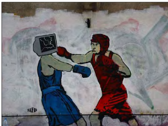
تصویر ۱۳- اثر نفیر