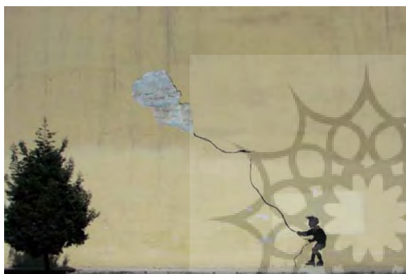
تصویر ۱۴- اثر نفیر