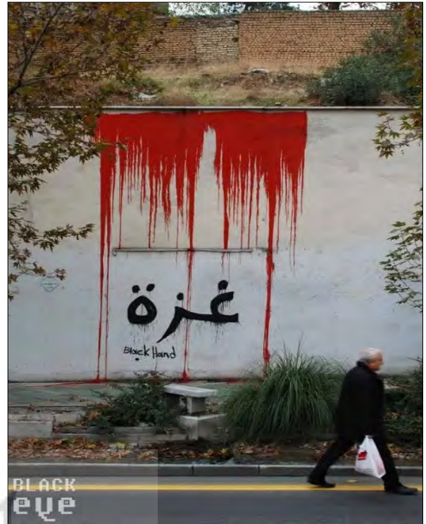
تصویر ۸- اثر بلک هند

هویت هنرمندان فعالین گرافیتی در ایران گاه در تقابل با دنیای هنر رسمی تصویر می‌شود. به عبارتی، به چالش گرفتن انحصارگرایی حاکم بر گالری‌ها و بی‌اعتبار شمردن عالم رسمی هنر نیز از اهداف این هنرمندان است. بدین‌سان، هنرمندان خیابانی همچون بلک‌هند می‌کوشند طلب هنرمندان خود را از حرفه هنرمندان