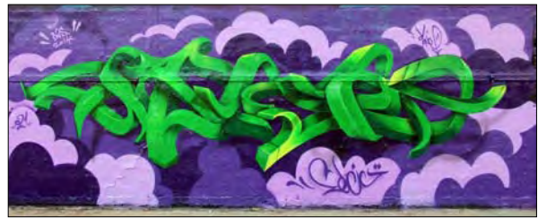
تصویر ۲۵- اثر تنها

توجه بسیاری را به خود جلب کند که نمونه‌ای از آثار او در ادامه قابل مشاهده است (تصاویر ۲۴ و ۲۵).