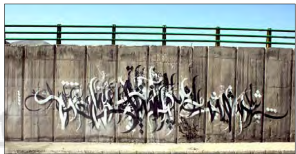
تصویر ۲۴- اثر تنها