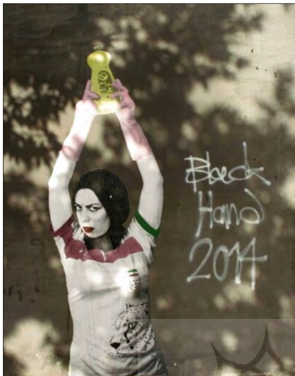
تصویر ۴- اثر بلک هند