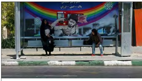
تصویر ۱۷- اثر نفیر