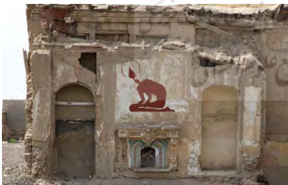
تصویر ۲۱- نمایشگاه بی همه چیز، اثر میرزا حمید Image 21 - Exhibition "Without Everything" by Mirza Hamid

آثار کمتر توجهی را به بازتاب مسائل سیاسی اجتماعی روز از خود نشان داده است و همچون انسان نخستین که از قرن بیست و یکم سر درآورده باشد به انعکاس تصاویر ذهنی خود بر دیوارهای می‌پردازد.