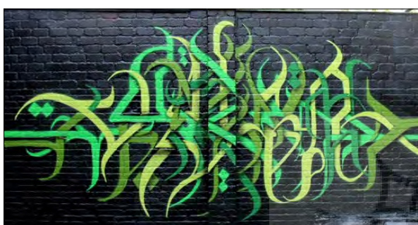
تصویر ۲۳- اثر تنها