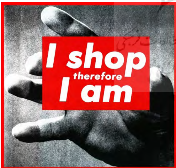
تصویر ۲- اثر بلک‌هند

اثر طعنه‌آمیز دیگری از بلک‌هند به موضوع فراگیر شدن شبکه‌های اجتماعی در ایران و تبعات اجتماعی آن اشاره دارد (تصویر ۲). جمله معروف دکارت فیلسوف دوران روشنگری که گفته بود «من می‌اندیشم، پس هستم» در دوران پست‌مدرن کارکردهای طعنه‌آمیزی نسبت به فرهنگ مصرفی دوران معاصر در برخی آثار هنری پیدا کرد. به عنوان مثال باربارا کروگر ۱ هنرمند سرشناس پست مدرن در یکی از آثارش جمله «خرید می‌کنم، پس هستم!» را بکار برده است (تصویر ۳). این اثر باربارا کروگر آشکارا این استعاره طعنه‌آمیز را پیش می‌کشد که «خرید کردن» (معامله تجاری) هویت انسان امروزی را تصاحب کرده است. بلک‌هند نیز در این گرافیتی این جمله را به «من لایک می‌زنم، پس هستم» بدل کرده است تا انفعال اجتماعی حاصل از مصرف بیش از حد فضاهای مجازی را به نحوی به چالش بکشد.