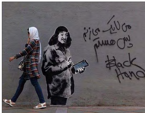
تصویر ۳- خرید میکنم پس هستم، اثر باربارا کروگر، ۱۹۸۷

علاوه بر چالش‌های اجتماعی مربوط به حضور زنان در عرصه‌های قهرمانی در ایران، مسئله ورود زنان به استادیوم‌های فوتبال طی سال‌های اخیر با فراز و نشیب‌های بسیاری همراه بوده است و به مشکلی سیاسی و ایدئولوژیک بدل گشته است. از این رو می‌توان موضع انتقادی بلک هند در بحث عدالت جنسیتی در جامعه ایرانی را در این گرافیتی به خوبی تشخیص داد. این اثر ارزشمند بلک هند همچون بسیاری دیگر از آثار گرافیتی مستقل که حاوی مضامین سیاسی / اجتماعی هستند پس از دو روز مخدوش گردید. بلک هند نیز در واکنش به این اقدام، گرافیتی دیگری را در اعتراض به این اقدام بر دیوار روبروی آن نقاشی کرد و به دفاع از هنر خیابانی پرداخت (تصویر ۵).