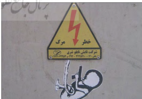
تصویر ۱۶- اثر نفیر

آثار گرافیتی میرزا حمید نسبت به آثار بلک هند و نفیر که در بخش های قبلی به آنها پرداخته شد، نگرشی متفاوت را در این هنر نشان می دهد. میرزا حمید نوعی بدوی گرایی را در کار گرافیتی دنبال می کند و فضاهای حاشیه ای و پستوهای شهر را همچون غارها می نگرد. از این رو خود نیز همچون هنرمندی غارنشین به ایجاد تصاویر گرافیتی بر دیوارهایی می پردازد که کمتر در معرض دید افراد جامعه است. او برخلاف سایر هنرمندان گرافیتی که اغلب از اسپری رنگ و کلیشه سازی برای اجرای تصاویرشان بهره می برند، با قلمو به کار می پردازد. به لحاظ مضمونی نیز آثار میرزا حمید ویژگی های خاص خود را یافته است. او در این