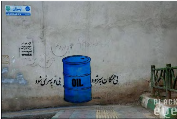
تصویر ۹- اثر بلک هند