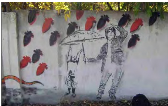
تصویر ۱۵- اثر نفیر