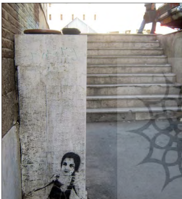
تصویر ۱۸- اثر نفیر (ماخذ: صفحه توئیتر هنرمند)