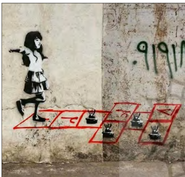
تصویر ۷- اثر بلک‌هند

توجه به کودکان و تأثیر کنش‌های اجتماعی ما بر آینده آنها در نمونه‌های دیگر از آثار بلک‌هند نیز بازتاب یافته است. در یکی از گرافیتی‌های او دختر خردسالی را مشاهده می‌کنیم که همچون سایر کودکان در این سن و سال به بازی «لی‌لی» مشغول است. در این بازی، خانه‌های مربعی شکی معمولاً با گچ یا زغال روی زمین ترسیم می‌شود و کودک باید با یک پا (اصطلاحاً لی‌لی‌کنان) از این خانه‌ها عبور کند تا به خانه آخر برسد. در این گرافیتی بلک‌هند خطوط بازی انگار باردی از خون بر زمین نقش بسته‌اند و (در برخی خانه‌ها «مین») قرار داده شده است (تصویر ۷).