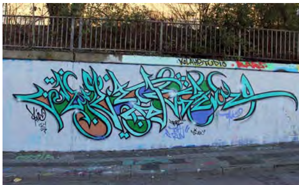
تصویر ۲۲- اثر تنها