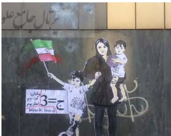
تصویر ۶- اثر بلک‌هند (ماخذ: صفحه فیسبوک هنرمند)

بلک‌هند همچنین در یک گرافیتی دیگر نیز موضوع ممنوعیت حضور زنان در استادیوم فوتبال را از زاویه دیگری مطرح نموده است. در این گرافیتی مادری را مشاهده می‌کنیم که به همراه دو فرزندش به تصویر درآمده است. هر دو کودک پسر هستند و با توپ و پرچم ایران در دست پسر بزرگ‌تر تصویر شده‌اند. این گرافیتی در نگاه اول تصویری ساده و معمولی به نظر می‌رسد. اما با دقت در تایپوگرافی که کنار آنها کشیده شده محتوای تصویر آشکار می‌گردد «مامان کی بریم استادیوم؟» نخستین سؤالی که برای مخاطب ایرانی در مواجهه با این گرافیتی پیش می‌آید این است که یک مادر چطور می‌تواند فرزندان علاقه‌مند به فوتبال خود را به استادیوم ببرد؟ او چه پاسخی می‌تواند به فرزندان خردسال خود درباره این محدودیت اجتماعی بدهد؟ (تصویر ۶).