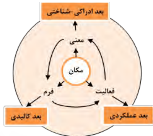
شکل ۲: ابعاد مشترک شکل‌دهنده مفهوم مکان در دیدگاه صاحب‌نظران

مدل‌ها و تعاریف متنوعی برای مفهوم مکان ارائه شده است که وجوه مشترکی نیز میان آن‌ها وجود دارد: طبق مدل کانتز مفهوم مکان از «فرم، فعالیت و معنا» تشکیل شده است و دارای سه بعد «کالبدی، عملکردی و ادراکی-شناختی» است.