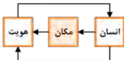
شکل ۱: رابطه عملکردی میان مفاهیم انسان، مکان و هویت

در مورد عوامل سازنده مفهوم «هویت» و اینکه کدامیک در شکل‌گیری این مفهوم مؤثرترند، منابع متعددی وجود دارد؛ آنچه مرتبط با بحث این پژوهش و مورد اتفاق نظر مطالعات پیشین است، معرفی «مکان»، به‌عنوان یکی از مهم‌ترین منابع ایجادکننده «هویت» است.