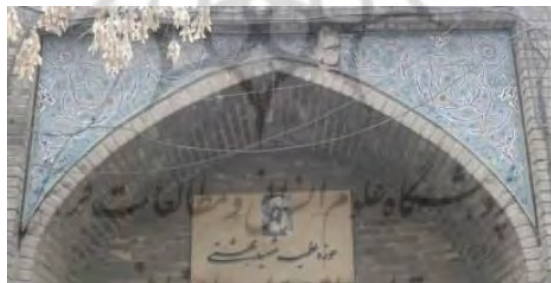
تصویر ۱. نقوش اسلیمی و ختایی مدرسه سپهسالار قدیم

نقوش گیاهی و هندسی از جمله مهم‌ترین نقوش مورد استفاده در تزئینات بناهای دوران اسلامی است. در تعدادی از مسجد-مدرسه‌ها نقش غالب نقش هندسی است؛ مثل عمارت مسعودیه. بیشترین تزئینات در بناهای دوره قاجار، بر روی کاشی‌کاری، حجاری و گچبری می‌باشد که از این میان کاشی‌کاری و بعد از آن حجاری حائز اهمیت است. فریه در کتاب خود با عنوان «هنرهای ایران» از مسجد-مدرسه سپهسالار جدید (شهید مطهری) و عناصر انشعابیش به‌عنوان یکی از ساختمان‌های خوب دوره قاجار اشاره می‌کند: «مدرسه سپهسالار از بهترین کاشی‌کاری‌های بناهای اسلامی برخوردار است (فریه، ۱۳۷۴: ۲۹۱)؛ به‌طوری‌که انواع نقوش گیاهی و هندسی در تزئینات حجاری، کاشی‌کاری و گچبری فضاهای مختلف این بنا به‌کار رفته است.