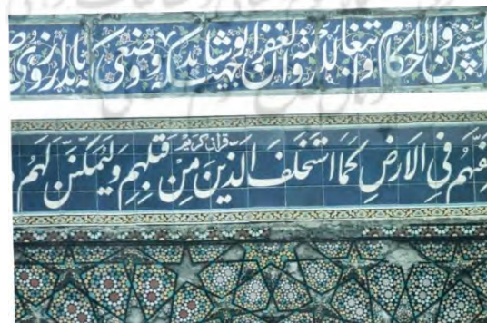
تصویر ۳. کتیبه نستعلیق ایوان بیرونی مسجد سپهسالار

در دوره قاجار هویت ایرانی تحت‌الشعاع هنر غربی قرار گرفت. لذا خط نستعلیق که خط کاملاً ایرانی است محور و نمادی از وحدت و نشانه هویت ملی و فرهنگی تلقی شد، منتها به این دلیل که خودشان را از تفکر به اصطلاح عربی بودن ایرانی‌ها جدا کنند از خط نستعلیق استفاده فراوان کردند. خط به رنگ سفید در زمینه لاجوردی یا به صورت برجسته در زمینه آجر به وجود آمده است. در برخی کتیبه‌ها، نقوش اسلیمی به رنگ زرد به عنوان زمینه کتیبه به کار برده شده و از کتراست بین خط نوشته و زمینه لاجوردی کاسته است و کتیبه‌ها به دلیل کوتاهی و پهن بودن حروف عمودی نستعلیق و قرار گرفتن در ارتفاع از فاصله دور ناخوانا و شلوغ به نظر می‌رسد. در این دوره شعر و ادب فارسی رواج پیدا کرد و بسیاری از هنرمندان خوشنویس، بیشتر اشعار منظوم فارسی در مدح پادشاهان یا متون وقف‌نامه‌ها نوشتند همچون کتیبه بالای سر در ورودی مسجد مدرسه سپهسالار قدیم در مدح پادشاه و وقف‌نامه بنا با خط نستعلیق است.