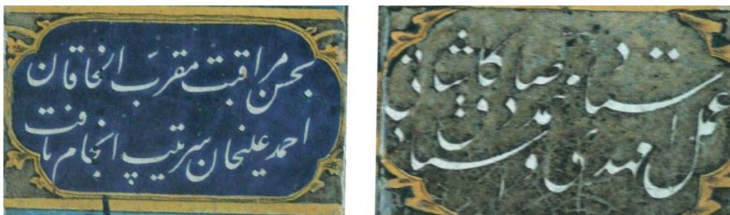
تصویر ۴. کاشیکاری، کتیبه نستعلیق مسجد مدرسه سپهسالار