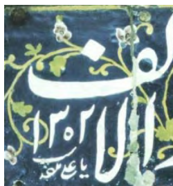
تصویر ۲. میرزا غلامرضا اصفهانی، کتیبه ایوان بیرونی مسجد مدرسه سپهسالار

باتوجه‌به گزارش عمارت خورشید در تاریخ مسعودیه چندین بار به نظامیه اشاره شده است که می‌توان نظامیه را همان مسعودیه دانست. شواهد نشان می‌دهد که شهرت مسعودیه به عمارت دولتخانه، بیرونی و سردر بوده است.