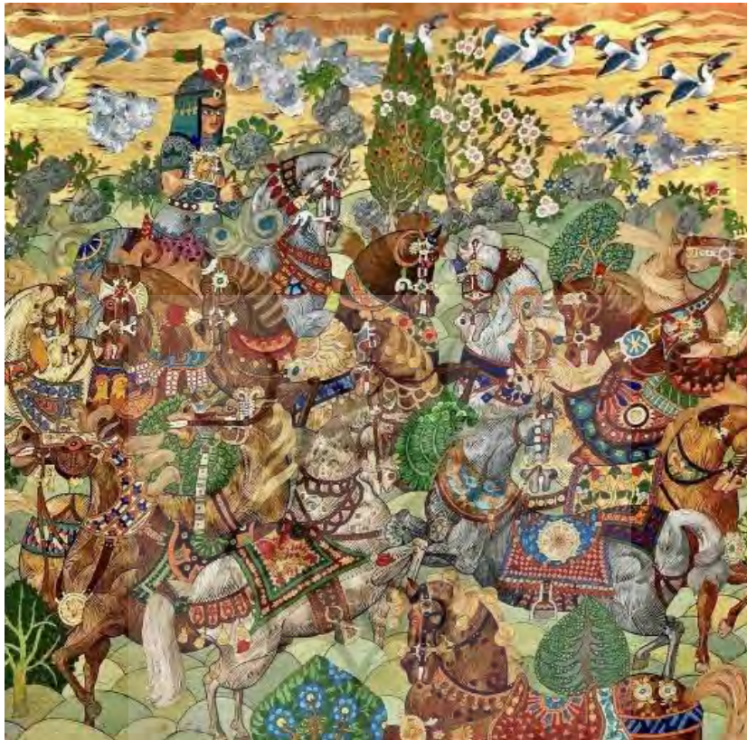
تصویر ۳. اثر خدا در جزئیات است از مجموعه آثار علی‌اکبر صادقی

چندمعنایی از هویت ایرانی و دنیای اساطیری؛ آرایه برای آنکه مرز اثر مشخص نیست؛ دلالت‌های جدید و متفاوت در زمینه‌ای متفاوت؛ استفاده از خودنگاره در دنیایی با فرم اساطیری و افسانه‌ای و نگاهی به داستان‌های شاهنامه، ضد روایت در واسازی تصویر برخلاف روایتگری نشانه‌شناسی ساختارگرا گونه‌ای ضدروایت در اثر می‌بیند که در این اثر باتوجه به فرم‌ها این مورد وجود دارد.