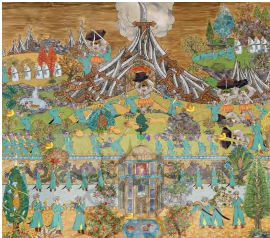
تصویر ۱. اثر بازگویی از مجموعه آثار علی‌اکبر صادقی

توصیف و تحلیل اثر بازگویی که در تصویر شماره ۱ آمده بدین‌گونه است: بینامتنیت در اثر نگاه متن به ارتباط گفت‌وگویی با متون دیگر و هیچ تفسیر و تأویلی نمی‌توان از آن داشت؛ نقاشی به سبک نقاشی‌های ایرانی تخت، از درخت سرو استفاده شده و انسان‌ها پوشش ایرانی دارند. در پایین تصویر قرینگی و ترکیب‌بندی ایرانی در کادر اثر دیده می‌شود؛ ولی شیوه رنگ‌زدن در آسمان متفاوت و برداشتی از نقاشی غرب است.