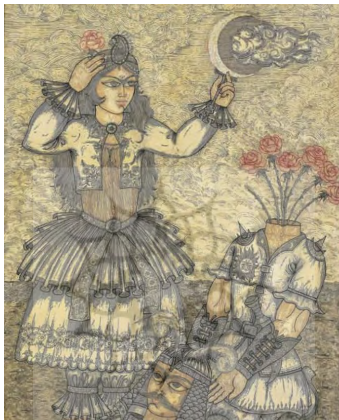
تصویر ۴. اثر سر بر قدمش نهاد از مجموعه آثار علی‌اکبر صادقی

استقلال نبوده مرتبط با سایر موضوعات اساطیری و افسانه‌ای است. در خوانش واساز هر اثر تنها ردپای مرجع یا مراجع دیگر است؛ همانند اثر فوق که ردپای آن را می‌توان در دنیای داستان‌های شاهنامه دید و که با اشکال نمادین و افسانه‌ای خلق شده است. چندمعنایی از هویت ایرانی و دنیای اساطیری، آرایه برای آنکه هم به درون اثر تعلق دارد و هم به بیرون آن، نه بیرون متن است نه درون آن. تمام آرایه‌های هنری مرکز متن دیده می‌شود و هم در حاشیه آن.