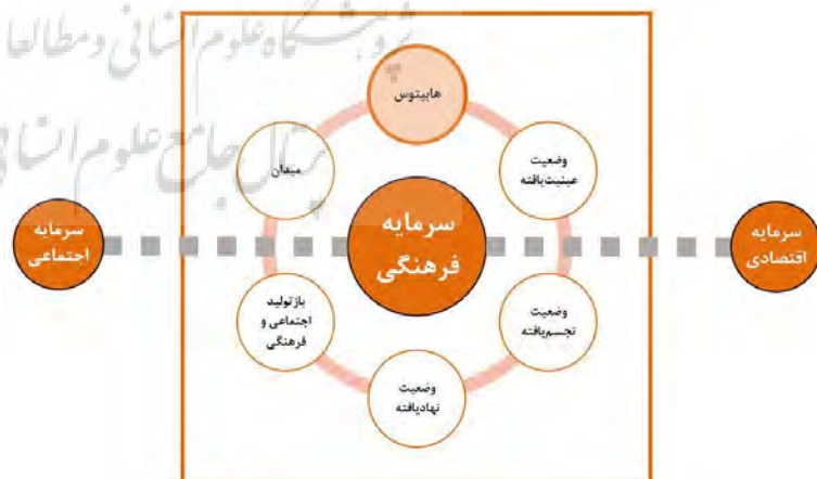
تصویر ۱. مدل شش مؤلفه‌ای سرمایه فرهنگی، با تأکید بر مؤلفه «هابیتوس»، و ارتباط آن با سرمایه اقتصادی و سرمایه اجتماعی.