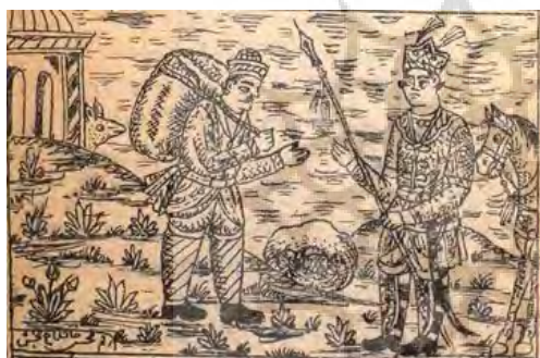
تصویر ۳. «گفت و گوی شاهزاده و پارچه‌بر»، به رقم محسن تاجبخش.

شیوه امضای تاجبخش در تمامی نگاره‌هایش به همان شکلی که در تصویر ۱ دیده می‌شود، باقی ماند و به ندرت تغییرات جزئی در آن وارد کرد. گاهی نیز در برخی نسخ که تاجبخش به طور مشترک با هنرمندی دیگر مصور می‌نموده، امضایش را ۲ بار و در دو طرف تصویر قرار می‌داده است (تصویر ۲). شاید دلیل این امر میزان رضایت هنرمند از کار خویش بوده باشد، چنانکه در برخی نسخ به جای رسم همیشگی‌اش در عنوان نمودن «محسن تاجبخش» از «محسن خان تاجبخش» استفاده کرده است (تصویر ۳).