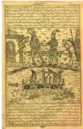
تصویر ۸. «رزم تن به تن امیر ارسلان با دیو»، به رقم محسن تاجبخش.