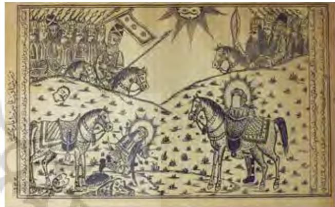
تصویر ۴. شهادت حضرت قاسم (ع)، به رقم محسن تاجبخش. منبع: طوفان البکاء، ۱۳۵۴، ۱۲۲.

تصویر ۵ برگگی دیگر از کتاب «طوفان البکاء» که به جشن عروسی رفتن حضرت فاطمه (س) را به تصویر کشیده است. بانو در حال گذر از کوچه‌ای است که از میان بناهای بلند می‌گذرد. فرشتگانی بالدار و تاج به سر که آینه و شمعدان و قرآن را به همراه دارند به بدرقه بانوی اسلام آمده‌اند. برخی از فرشتگان نیز جامه ایشان را گرفته‌اند تا به خاک زمین آلوده نشود. در آن زمان که ایشان در سوگ رحلت حضرت خدیجه به سر می‌برند، غرض از دعوت ایشان توسط زنان قریش، آزار حضرت فاطمه بود؛ ولیکن شکوه و عظمت حضور بانو، تحسین و حیرت زنان نظاره‌گر را برانگیخته و ایشان انگشت حیرت به دهان گرفته‌اند. کادر تصویر عمودی است و مانند تصویر ۴ جز چند سطر متن مختصر، تصویر تمام صفحه را به خود اختصاص داده است. تصویر تقریباً از دو قسمت مساوی تشکیل شده است. در نیمه پایینی رویداد اصلی در حال جریان است و حضور پیکرها را در این نیمه می‌بینیم و نیمه بالایی به بافت‌های متنوعی از دیوارهای آجری و پنجره‌های قوس‌دار اختصاص داده شده و به گونه‌ای تداعی‌گر فضای شهری تهران عهد قاجاری است. تمام فضای کادر از عناصر بصری پوشیده شده است و هنرمند برای ایجاد حس تعادل و توازن با قرار دادن چند سطح سفید برای درب یک خانه در پیش‌زمینه، هاله نورانی به دور سر بانو و چند پنجره در میانه تصویر این کار را انجام داده است. جز بانو که جامه اعراب به تن دارد، سایر پیکرها پوششی به مانند آنچه در غالب نگاره‌های قاجار دیده می‌شود به تن دارند. حالت چهره‌ها به جز زن ایستاده در ایوان همگی سه رخ