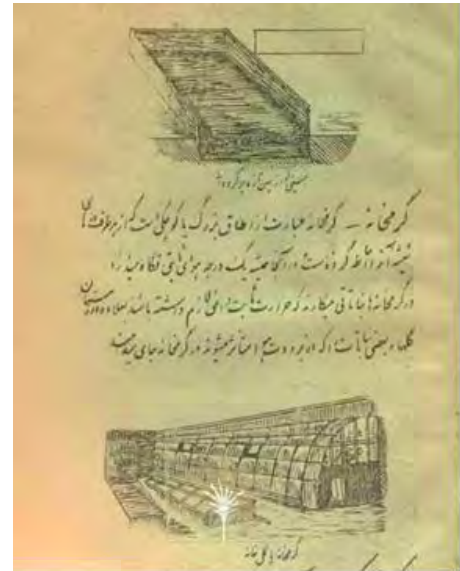
تصویر ۱۴. تصویر گرم‌خانه به رقم محسن تاجبخش.

برای درک بهتر شاخصه‌های تصویرگری محسن تاجبخش، جدول ۲ به‌منظور تحلیل بصری آثار وی ارائه شده است.