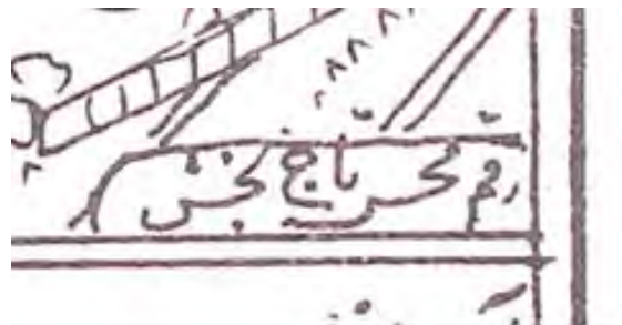
تصویر ۱. امضای محسن تاجبخش.

شیوه امضای تاجبخش در تمامی نگاره‌هایش به همان شکلی که در تصویر ۱ دیده می‌شود، باقی ماند و به ندرت تغییرات جزئی در آن وارد کرد. گاهی نیز در برخی نسخ که تاجبخش به طور مشترک با هنرمندی دیگر مصور می‌نموده، امضایش را ۲ بار و در دو طرف تصویر قرار می‌داده است (تصویر ۲). شاید دلیل این امر میزان رضایت هنرمند از کار خویش بوده باشد، چنانکه در برخی نسخ به جای رسم همیشگی‌اش در عنوان نمودن «محسن تاجبخش» از «محسن خان تاجبخش» استفاده کرده است (تصویر ۳).