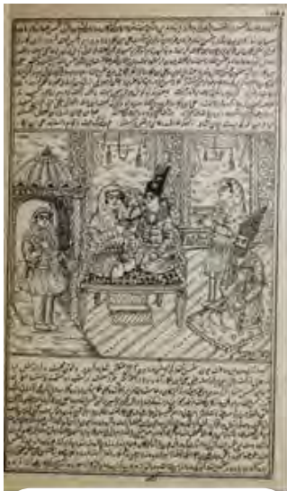
تصویر ۷. «مجلس بزم علی بن بکار و شمس النهار»، به رقم محسن تاجبخش. منبع: هزار و یک شب، ۱۳۵۲، ۱۱۸.

تصویر ۹ برگگی است از کتاب «اسکندرنامه» که رزم فرهنگ و محمد شیرزاد را به طور هم‌زمان با یک واقعه دیگر به تصویر کشیده و فضایی یکسان برای هر دو در نظر گرفته است. در این تصویر نیز مانند سایر کتب عامیانه-عاشقانه کادر تصویر و متن فضای یکسانی را اشغال نموده‌اند و اصل ترکیب بندی بر قرینه‌سازی استوار است. رویداد اصلی که در مرکز تصویر قرار دارد، فرهنگ را کلاه خود به سر و زره بر تن در وضعیت نیم‌رخ با محاسنی بلند، در حالی که در یک دست ساطور و در دست دیگر نیزه دارد، با چهره‌ای غضبناک نشان می‌دهد که در حال مبارزه با محمد شیرزاد است. ناظرین یکی سوار بر اسب و دیگری درون کاخی آراسته به ستون‌ها و انواع تزیینات و سقف گنبدی در دو طرف کادر وجود دارند. سایر پیکره‌ها نیز از پوشش مشابهی برخوردارند. در نیمه پایینی کادر رویداد دیگری که مربوط به صفحه قبل بوده، در حال وقوع است و دزدان دریایی را سوار بر کشتی در دریا نشان می‌دهد. به نظر می‌رسد هنرمند برای اینکه بتواند دو رویداد را در کادر تصویر بگنجانند، رویداد فرعی‌تر را در اندازه‌ای کوچکتر نمایش داده، به طوری که کشتی چونان قایقی کوچک در برکه آبی تداعی می‌شود با ماهیانی که در حال بازی در آب هستند.