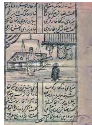
تصویر ۱۱. یاری طلبیدن فرزند عاق شده از پیامبر (ص)، به رقم محسن تاجبخش.