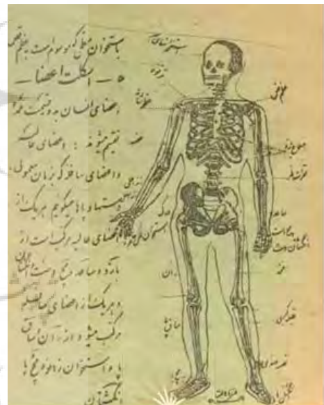
تصاویر ۱۲ و ۱۳. آناتومی بدن انسان و تصاویر غذایی به رقم محسن تاجبخش. منبع: علم‌الاشیاء، ۱۳۴۴، ۱۲ و ۴۶.