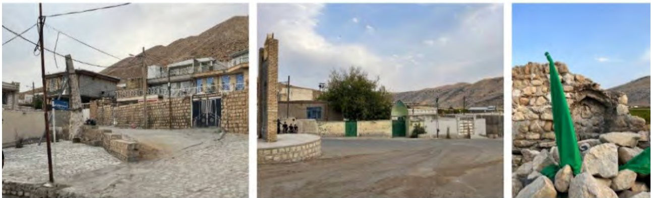
تصویر ۶. عناصر هویتی و اجتماعی روستای خسروآباد (راست به چپ: آتشکده باباسلام، مرکز محله، میل).