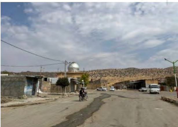
تصویر ۴. محور اصلی تعریض شده ورودی روستا ابوالوفا منتهی به امامزاده.

هادی، طرح وزارت نفت، طرح وزارت نیرو و طرح توسعه اوقاف که هر کدام طبق سیاست‌های خود مداخلاتی را در روستاها اعمال می‌کنند، عامل مهمی در عدم توازن زیست و رشد روستایی هستند. این برنامه‌ها بدون توجه به بافت روستا و مردم بومی پیشروی می‌کنند و موجب آشفتگی در ساختار و توسعه نامتوازن می‌شوند. باتوجه به آمار مذکور در مقاله خراسانی و محمدی (۱۴۰۰) مبنی بر میزان فقر در روستای سرخ‌دم لکی به نسبت شهرستان کوه‌دشت، می‌توان دریافت که اجرای طرح هادی و پروژه‌های زیرساختی از جمله طرح وزارت نیرو و عبور خطوط لوله انتقال گاز از میان زمین‌های زراعی و کشاورزی روستاییان (تصویر ۲)، تأثیر مخربی بر رفاه اقتصادی، معیشت، شغل و زیست اهالی روستای سرخ‌دم لکی داشته است و موجب فروش زمین کشاورزان، نابودی فضای کشاورزی، محدود کردن دسترسی به زمین‌ها، آسیب به محصولات زراعی و کاهش کیفیت زیرساخت‌های معیشتی و آموزشی شده است.