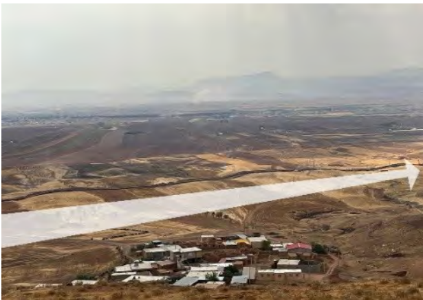
تصویر ۲. عبور خطوط لوله گاز از میان زمین‌های کشاورزی در روستا سرخ‌دم موجب از هم گسیختگی زمین‌ها و آسیب به نحوه معیشت روستاییان شده است.