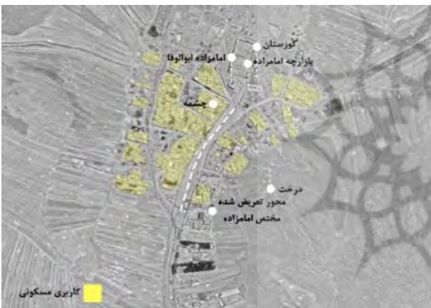
تصویر ۳. نقشه هوایی روستای ابوالوفا و نشانه‌های هویتی و اجتماعی موجود.