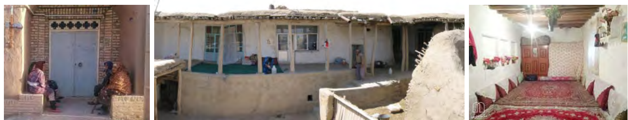
تصویر ۶. فضاهای جمعی روستا در خانه‌های بومی.