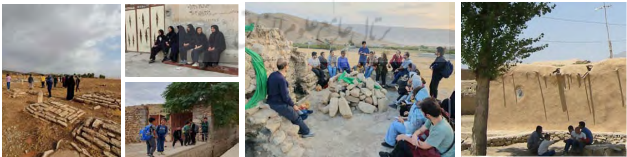
تصویر ۵. فضاهای جمعی روستا.

امروزه با تغییر شکل روستاها و تغییر اهداف در برنامه توسعه، روستا شکل متفاوتی از فضاهای جمعی را تجربه می‌کند. اگر فضای جمعی بر سه مؤلفه کالبد، عملکرد (عمدتاً اقتصاد) و معنا در نظر گرفته شود، براساس یافته‌های پژوهش فضای جمعی در شهر غالباً تحت‌تأثیر فعالیت و عملکرد شکل گرفته است که در گذر زمان کالبد و معنا می‌یابد. مانند فضاهای بازارگاهی و عبادی، درحالی‌که شکل‌گیری فضای جمعی روستایی با محوریت معنا است. فضای جمعی که از بطن خانه‌ها شروع شده و تا کوچه و محله تداوم می‌یابد و بی‌نیاز از کالبد و عملکرد خاص، حضورپذیر است. بنابراین ماهیت فضای