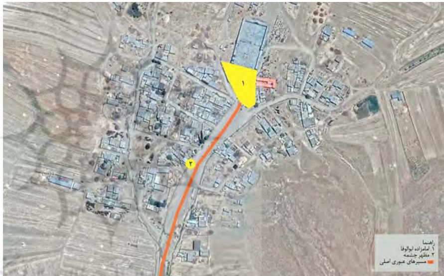
تصویر ۴. فضاهای جمعی روستای ابولوفا.