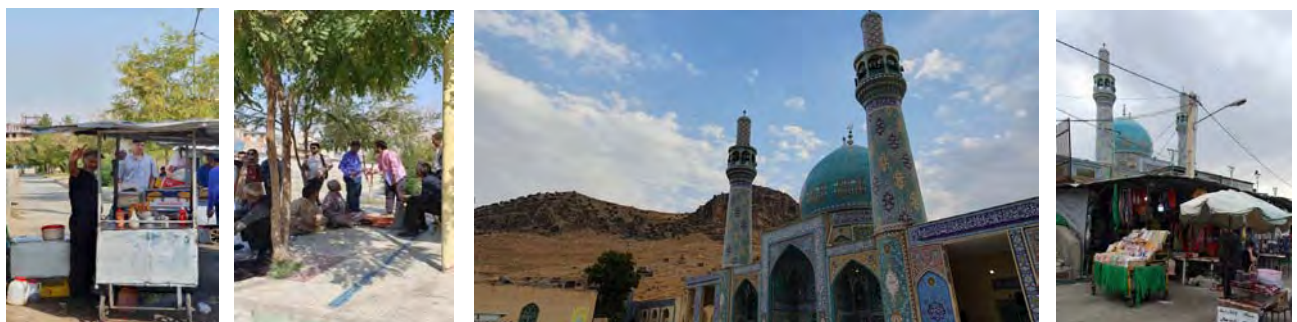
تصویر ۲. فضاهای جمعی در شهر.