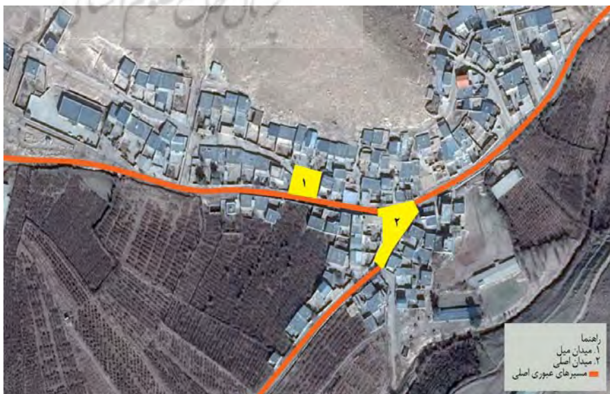
تصویر ۳. موقعیت فضاهای جمعی روستای خسروآباد.