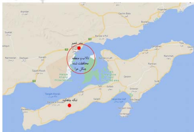
تصویر ۲. جانمایی دره چاه کوه واقع در جزیره قشم و جنگل های محافظت شده حرا در بندر خمیر.

۱. به کارگیری جامعه محلی در فرایند مدیریت فضا به شکل انعطاف پذیر و چندگانه نظیر استخدام دائمی راهنمایان محلی و به کارگیری هم یاران افتخاری در دوران اوج بازدیدها، ۲. تقویت ارزش استفاده فضا در عین حفظ ارزش ذاتی آن نظیر تجهیز محیطی و کالبدی فضا برای عبور و مرور به شکلی زمینه ساز، ۳. به کارگیری خرد بومی و ارزش های فرهنگی برای ایجاد جاذبه های گردشگری