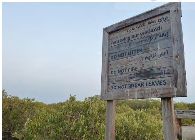
تصویر ۴. آموزش دادن ارزش‌های طبیعی و فرهنگی جنگل‌های حرا به بازدیدکنندگان در حین بازدید و تجربه ملموس آن.

منظر به‌عنوان پدیده‌ای حاصل تعامل انسان و محیط، پدیده‌ای هم‌زمان طبیعی-فرهنگی است. این مسئله به دلیل استفاده مشترک جوامع محلی و نهادهای مدیریتی از بستر طبیعی دریا در شهرهای دریایی و دریاپایه نمودی برجسته دارد. خلاء دیرینه میان علوم زیستی و اجتماعی در چگونگی حفاظت از میراث مشترک بشری به‌عنوان پدیده‌ای فرهنگی-طبیعی، به‌طور مستقیم بر شرایط فعلی موردهای مطالعه شده تأثیر داشته است. عدم یکپارچگی کامل جوامع محلی و نهادهای مدیریتی به هدررفت ظرفیت‌های گردشگری این سایت‌ها منجر شده و ایجاد فضایی غیرمولد را به همراه داشته است. این در حالی است که درپیش گرفتن دیدگاه میان‌رشته‌ای منظر با تمرکز بر نقاط توافق و مشترک میان دو گانه‌های یادشده، نتایج بهتری را برای حفاظت فراهم می‌آورد. دورنمای حفاظت هم‌زمان از میراث طبیعی و فرهنگی ممکن است تیره و تار به نظر برسد، اما زمینه نوظهور و راهنمایی را به سوی چگونگی ایجاد پل بر شکاف طبیعت/فرهنگ نشان می‌دهد. این امر مستلزم جست‌وجوی زمینه