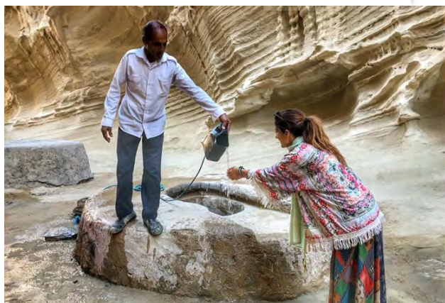
تصویر ۳. تجربه ملموس خرد بومی در مدیریت زیرساخت های طبیعی تنگه چاه کوه.

۱. برگزاری کارگاه ها و رویدادهای برنامه ریزی شده برای آموزش جامعه محلی از جمله ایجاد مرکز سیپا در بندر خمیر با هدف آموزش، افزایش مشارکت و افزایش آگاهی مردم، ۲. تخصیص تسهیلات اقتصادی و منابع مالی به جامعه محلی در جهت تجهیز و ارائه امکانات گردشگری از جمله ارائه وام و کمک هزینه جهت ساخت اقامتگاه بومگردی در