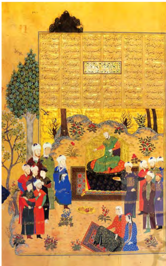
تصویر ۱. نگاره سپردن بهرام پسر یزدگرد را برای تربیت به منذر، امیر عرب، شاهنامه بایسنقری، گنجینه کاخ گلستان، مأخذ: سمسار: ۱۳۷۹: ۱۰۷.

زیبایی و هنر در نظام سیاسی ایران یک امر ضروری بود. اندرزنامه‌ها برای القای مطالب خویش به پادشاهان بیشتر از روش غیرمستقیم و بیان مقصد در قالب حکایات تاریخی، قصه‌گویی و تمثیل استفاده می‌کردند (یوسفی راد، ۱۳۸۷: ۲۵۷). در اندرزنامه‌های ادبی شاه به‌عنوان مخاطب غیرمستقیم بود. در این اندرزنامه‌ها روایت‌هایی در راستای تعلیم آداب حکومت و ملکداری بر اساس مؤلفه‌های مفهومی قدسی اندیشه ایرانی شهری طرح می‌شد. از قدیمی‌ترین اندرزنامه‌های به‌جای مانده از دوران اسلامی، می‌توان به اندرزنامه قابوس بن وشمگیر اشاره کرد. در پیوند با اندرزنامه‌های ادبی، بسیاری از آثار نگارگری ایران نیز بر اساس سنت اندرزنامه‌ای مصور شده و بر بستر هنر کتاب‌آرایی تجلی یافته‌اند. از نظر روش، نگارگری از شیوه متون اندرزنامه‌ای یعنی گنجاندن نکات سیاسی در دل یک امر زیبایی‌شناختی برای بیان محتوا استفاده می‌کرد. هدف از این نگاره‌ها بهره‌گیری از تمهیدات بصری و زیبایی‌شناختی برای ایجاد مجرای جهت‌تعلیم بی‌هنر