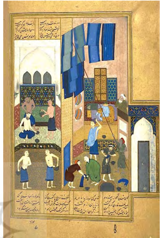
تصویر ۶. نگاره هارون‌الرشید در حمام، اثر کمال‌الدین بهزاد، خمسه نظامی، کتابخانه سلطنتی بریتانیا، (Or. 6810).

همان‌گونه که بنیان شکل‌گیری آرمان‌شهر بر اشته، لزوم