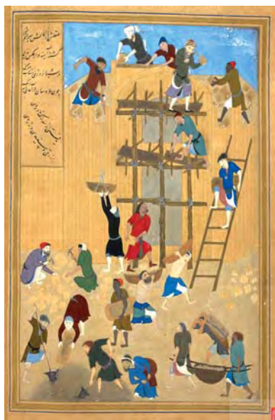
تصویر ۷. نگاره بنای کاخ خورنق، اثر کمال‌الدین بهباد، خمسه نظامی، کتابخانه سلطنتی بریتانیا، (Or. 6810)، مأخذ: همان