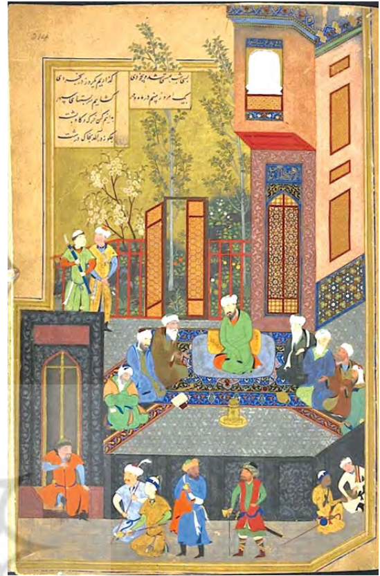
تصویر ۴. نگاره خلوت اسکندر با هفت حکیم، اثر کمال‌الدین بهزاد، خمسه نظامی، کتابخانه سلطنتی بریتانیا، (Or. 6810).

بنا به اندیشه ایرانشهری لازم بود تواناترین فرزند شاه با کسب آموزش سیاسی از کودکی برای جلوس بر جایگاه شاهی حفاظت و تربیت شود. این در حالی است که عدم توجه و درک سلاطین، منازعات درونی دربار و به‌ویژه نقش خاتون‌های تیموری، عاملی برای قتل، تغییر نابهنگام جانشین و یا اساساً عدم اعلام رسمی جانشین توسط سلطان بود. بنابراین علیرغم این‌که پس از جنگ‌های پی‌درپی توسط تیمور، شاهرخ با خروج از سنت‌های چادر نشینی، به بزرگان ایرانی متکی شد و اقدامات او به آبادانی وسیعی در خراسان منجر شد، اما به دلیل شرایط سیاسی و بی‌توجهی شاهرخ، جانشین رسمی توسط سلطان اعلام نشد. در نتیجه سامان نویافته اجتماع به بیداد بدل گشته و بحران طولانی مدتی رخ نمود (لطف‌آبادی، ۱۳۹۸). توطئه‌ها و جنگ‌های داخلی بین بازماندگان باعث گسست در حکومت تیموریان، ضعف آن‌ها و در نهایت بروز بی‌سامانی گسترده شد. با پایان آشوب‌های طولانی و روی کار آمدن سلطان