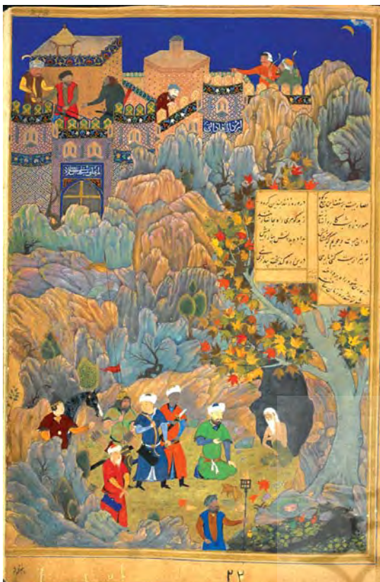
تصویر ۵. نگاره اسکندر و زاهد، اثر کمال‌الدین بهزاد، خمسه نظامی، کتابخانه سلطنتی بریتانیا، (Or. 6810)، مآخذ: همان.

نوشته‌های تاریخ هزارساله ادب فارسی به فهم ساحت سیاسی آن نوشته‌ها وابسته است» (طباطبایی، ۱۳۹۹ ب: ۹۲). همچنین خمسه نظامی برخی از مهم‌ترین بروزات اندیشه‌های سیاسی را با بهره‌گیری از هنر و ادب فارسی، بر بستر سنت اندرنامه نویسی، آشکار می‌کند (طباطبایی، ۱۳۹۹ ب: ۱۱۰-۱۱۶؛ ظهیری ناو، ۱۳۸۹؛ کشاورز افشار، ۱۳۸۹؛ کرمی و نوروزی، ۱۳۸۷؛ رجایی، ۱۳۷۳: ۳۷-۴۹) در میان مفاهیم و آموزه‌های سیاسی متعدد، یکی از اندرزه‌های اصلی روایت بهرام در هفت‌پیکر نظامی، توجه دادن شاه به اهمیت تربیت شاهزادگان و مسئله جانشینی است. با بازتولید نسخه خمسه نظامی، فراهم ساختن اندرنامه‌ای در دستور کار کتابخانه سلطنتی که تحت تأثیر امیر علیشیر نوایی بود قرار می‌گیرد. در حدود سال ۹۰۰ هجری قمری یعنی سه سال قبل از شکل‌گیری توطئه خدیجه‌بیگی آغا، این نسخه به سرانجام رسید. به نظر می‌رسد هدف از تولید این نسخه از خمسه نظامی، توجه دادن سلطان به اهمیت مسئله دادگری در آداب حکومت‌داری است. این نسخه از خمسه نظامی با کد Or. ۶۸۱۰ در کتابخانه