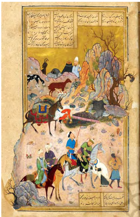
تصویر ۳. پیرزن و سلطان سنجر اثر کمال‌الدین بهباد، خمسه نظامی ، کتابخانه سلطنتی بریتانیا، (Add MS 25900).

می‌کند: «پادشاه عادل، سایه لطف حق است در زمین که پناه می‌گیرد به وی هر مظلومی» (کاشفی، ۱۳۲۱: ۲۵). همچنین در اخلاق محسنی با تأکید بر سرلوحه بودن دادگری در نسبت با کلیه امور تأکید می‌کند: «قائده عدل بخاص و عام و خرد و بزرگ و اصل گردد و مناجح ارباب دین و دولت و مصالح اصحاب ملک و ملت به برکت آن قائم و منتظم شود و ثواب عدل از حد حساب افزون است» (همان: ۲۳) و در تداوم آن آموزه‌های خود در باب دادگری را در بستر سنت اندرزنامه نویسی طرح می‌کند (تاجیک نشاطیه، ۱۳۹۴). قابل توجه است که بنا به اندیشه سیاسی ایرانشهری «خواجه انظام‌الملک»، در قلمرو اندیشه سیاسی، رعایت عدالت را مقدم بر اجرای شرع می‌داند و بر آن است که پایداری ملک به رعایت عدالت وابسته است» (طباطبایی، ۱۳۹۹: ب: ۴۹). جامی نیز در روضه سوم بهارستان اهمیت دادگری را چنان بالاتر از دیگر ضرورت‌های شاهی طرح می‌کند که دادگری به عنوان وجه لازم حکومت‌داری تعریف می‌شود: «حکمت در وجود سلاطین، ظهور نَصفت و عدالت است، نه