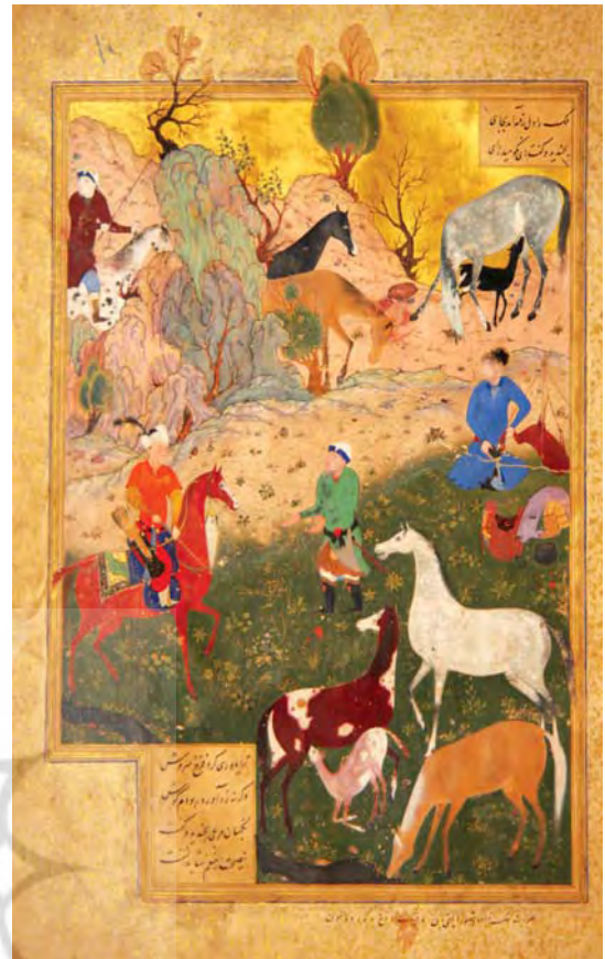
تصویر ۲. نگاره شاهی دارا و رهمدار، اثر بهزاد کمال‌الدین بهزاد، نسخه بوستان سعدی، دارالکتب قاهره، مصر، مأخذ: Balfrej, 2019: 35.

با گسترش اسلام به مرزهای ایران، نظام شهریاری و نهاد وزارت فروریخت؛ اما در زمان کوتاهی با شکل‌گیری خلافت اموی و عباسی، بنا به ضرورت‌های ملکه‌داری، دبیران و وزیران ایرانی با تکیه بر دانش دیوانی، مجدداً در عرصه سیاسی حضور یافتند. در این دوران یکی از مهم‌ترین تأثیرات آن‌ها، ترجمه متون و بازیابی اندیشه ایرانشهری توسط افرادی همچون ابن‌مقفع و البته تأثیرگذاری هرچند