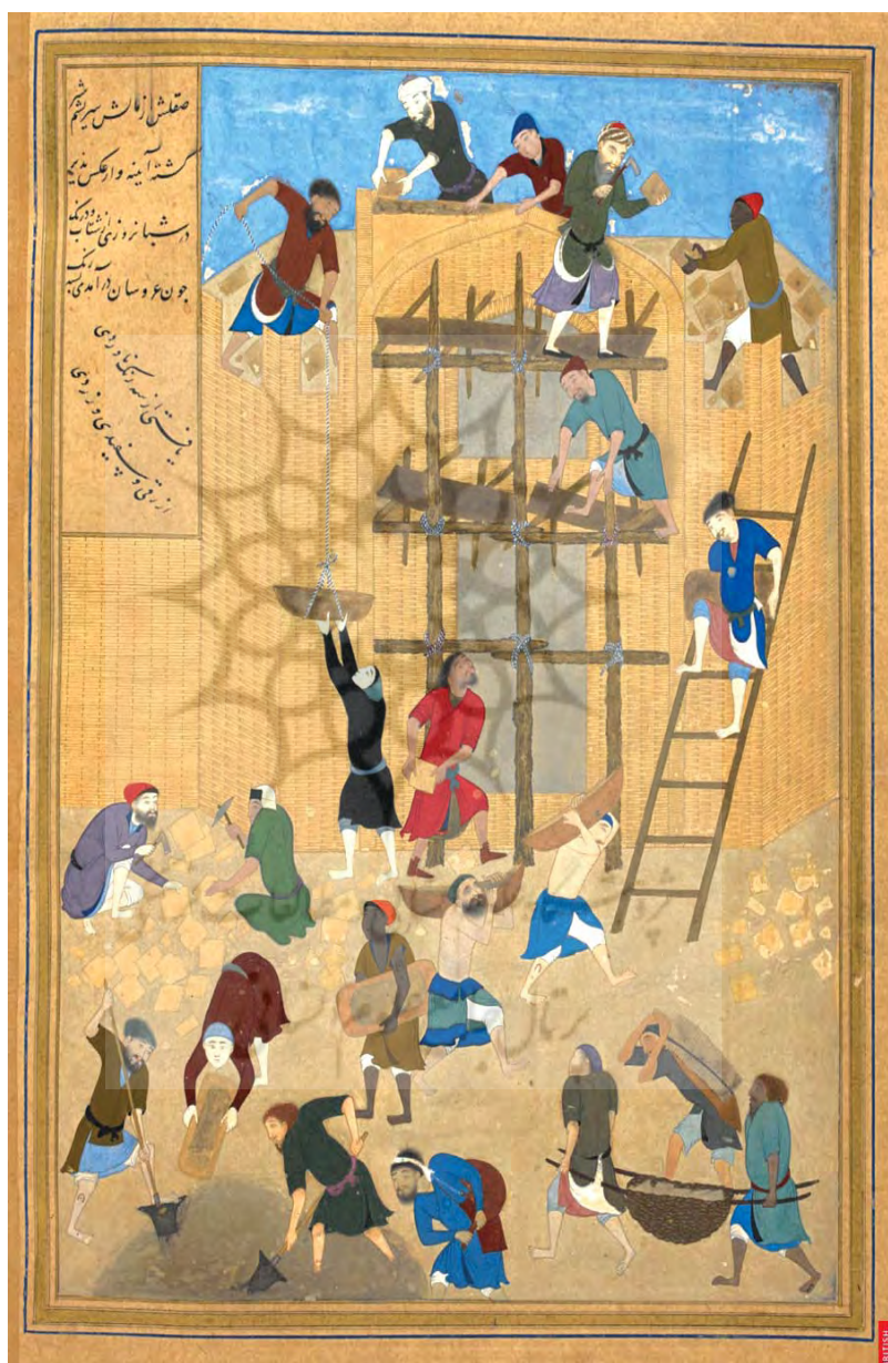
نگاره بنای کاخ خورنق، اثر کمال‌الدین بهزاد، خمسه نظامی، کتابخانه سلطنتی بریتانیا، (Or. ۶۸۱۰)