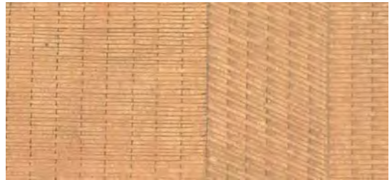
تصویر ۸. بخشی از نگاره بنای کاخ خورنق، اثر کمال‌الدین بهزاد، خمسه نظامی، کتابخانه سلطنتی بریتانیا، (Or. 6810).

اولین الزام بنای آرمان‌شهر انطباق آن با اشته بود. در روایت نظامی نیز بنای کاخ مطابق با اشته توصیف می‌شود و کیفیات آرمان‌شهر را مورد تأکید قرار می‌دهد. همان‌طور