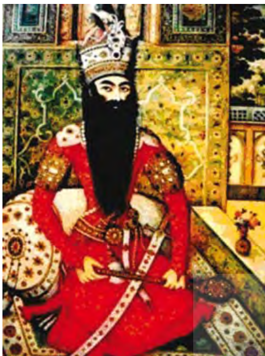
تصویر ۴. چپ: تصویر فتحعلی شاه، نقاش: میرزا بابا، تاریخ: (۱۸۱۰ میلادی)، ایران، مأخذ: Raby, 1999: 42.