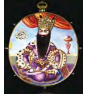
تصویر ۱۰. تمثال نقاشی شده از فتحعلی شاه قاجار، تاریخ: سده هفدهم میلادی، ۱۷۹۷-۱۸۳۴، ایران، سایز اثر: ۷۸ سانتی‌متر،