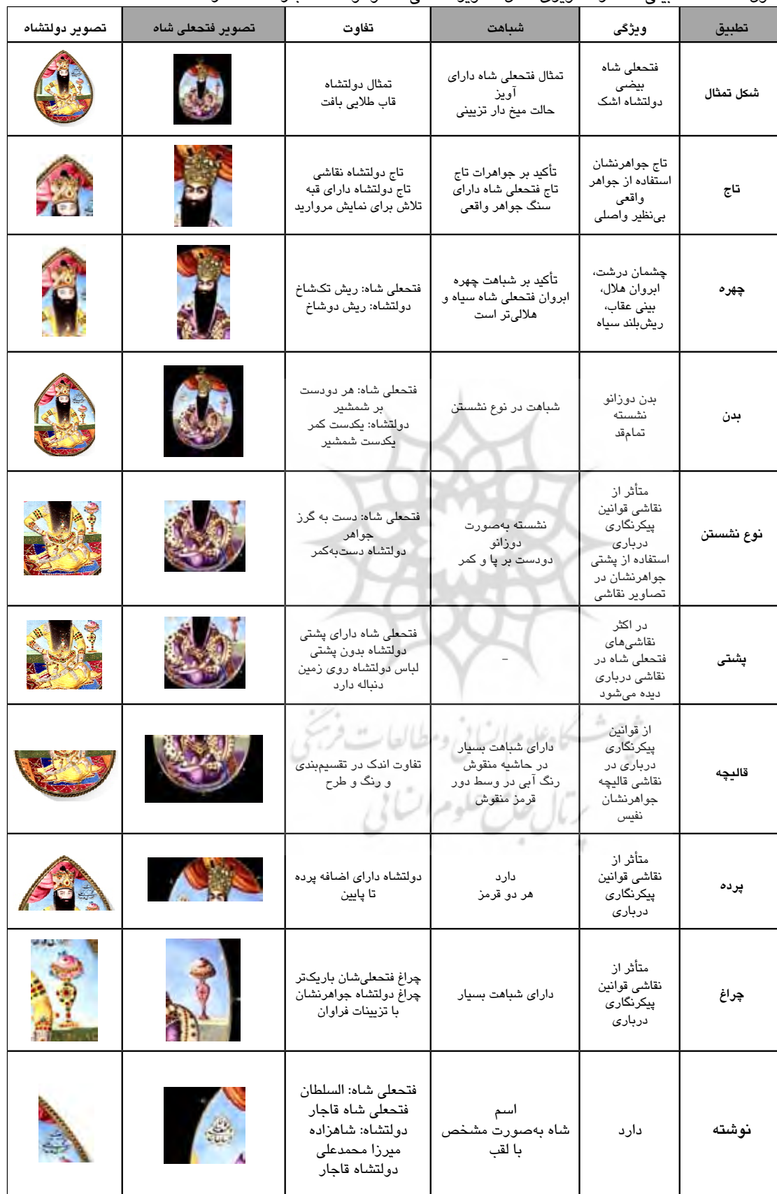
جدول ۲. مطالعه تطبیقی عناصر تصویری تمثال تصویر فتحعلی شاه و دولتشاه قاجار

مطالعه تطبیقی هنر پیکرنگاری درباری محمدعلی دولتشاه حاکم کرمانشاه در دوره قاجار (۱۳۳۷-۱۱۶۷) با آثار دوره فتحعلی شاه قاجار ۹۱-۷۳/ (۱۲۵۰-۱۲۱۲)