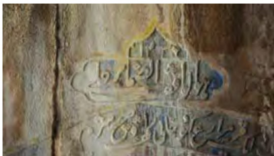
تصویر ۱۶. سال وقف: ۱۲۳۷ هجری - قمری، متن کتیبه: «هو الوقف الضمام بر علی، مزارع کبود خانی»، مأخذ: سازمان میراث فرهنگی کرمانشاه.