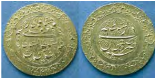
تصویر ۱۳. سکه‌های یادبود فتحعلی شاه، دارالسلطنه تهران ۱۲۲۷ هـ.ق/۱۸۱۳ میلادی، نوشته پشت سکه: دارالسلطنه اصفهان، روی سکه: السلطانابن السلطانابن السلطان فتحعلی شاه قاجار، مأخذ: همان.

مرحوم شاهزاده را نشسته و «حشمت‌الدوله» پسرش و پسر کوچک دیگرش «طهماسب میرزا مؤید الدوله» را داده است حجاری کرده‌اند... اما در این حین بعضی سیاحان فرنگی در تشخیص شخصیت‌های مصورشده با مشکل مواجه بوده‌اند.