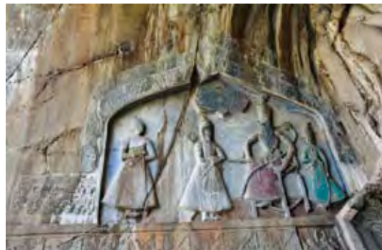
تصویر ۱۹. نمای کلی سنگ‌نگاره دولت‌شاه، فرزند آقا غنی، طاق‌بستان، کرمانشاه، مأخذ: همان.

جدول ۵. مطالعه پیکرنگاری درباری در هنر دولت‌شاه، مأخذ: همان