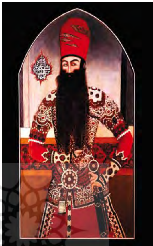
تصویر ۸. چهره شاهزاده محمدعلی دولت‌شاه، امضا: ندارد احتمالاً جعفر؟ تاریخ: سده ۱۹ میلادی، شیوه: رنگ و روغن روی بوم .

روابط دوستانه با کشورهای دیگر تمثال و تصویرهای پادشاهان بین دو طرف ردوبدل و به خدمت‌گزاران داخلی و امرا و سران خارجی اهدا می‌شد (مفخم، ۱۳۴۷: ۱۰۲). در دوره معاصر ایران اعطای نشان‌های رسمی از سوی «فتحعلی شاه» قاجار آغاز می‌شود (فیاضی، ۱۳۸۸: ۶۲۹). اولین نشان ایران که به صورت رسمی اهدا شده، در زمان «فتحعلی شاه» دومین شاه قاجار بوده است که نشان «شیر و خورشید» نام داشته است، البته سکه‌هایی با کاربرد احتمالی مدال مربوط به دوره «آقامحمدخان» نیز موجود است که احتمالاً کاربرد مدال داشته است. در زمان «فتحعلی شاه» نشان عجیبی به نام «نشان فتح» به رجال شهر تبریز اهدا شد که به مناسبت شکست ایران در جنگ‌های دوم ایران و روس و معاهده ترکمانچای بود (مشیری، ۱۳۵۰: ۱۹۵)؛ همان‌طور که بیان شد در دوره قاجاریه به سکه‌های یادبود که گاه به سبب پیروزی‌های ویژه، جشن‌ها و مراسم ملی ضرب می‌شد «مدال» نیز گفته می‌شد (شمس اشراق، ۱۳۶۹: ۱۱). تصاویر ۹ تا ۱۱ تمثال‌های نقش «فتحعلی شاه» و یک شاهزاده قاجاری است. در تصاویر ۱۲ و ۱۳