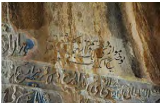
تصویر ۲۰. بخشی از خط وقف نامه دور سنگ‌نگاره دولت‌شاه، طاق‌بستان، مأخذ: همان.

«فتحعلی شاه» عمل می‌کرده است و بر قدرت‌نمایی شاهزاده، نمایش شکوه و جلال و فرزندان پس از او اشاره داشته است. این موارد در جدول ۵ جمع‌بندی شده است.