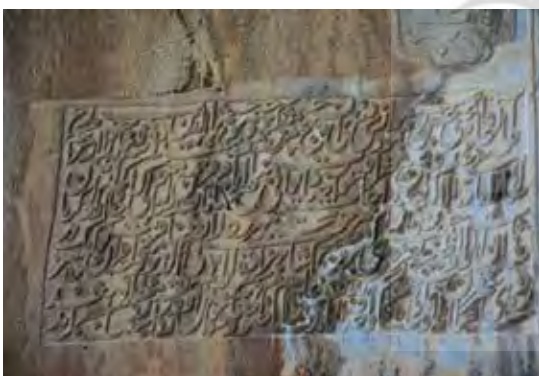
تصویر ۱۸. کتیبه وقف و توضیحات وقف شاهزاده دولت‌شاه، مأخذ: همان.

هنر برای نمایش خود استفاده کرده و سعی کرده بر عدم ولیعهدی خود اعتراضی تصویری داشته باشد. تنوع آثار به دست آمده از دربار «محمدعلی دولت‌شاه» نشان می‌دهد، او دربار فرهنگی و هنری فعالی داشته و کاشف به ارزش تصویر نیز بوده و این هنرها هدفمند انجام شده است. هنر در دربار دولت‌شاه در ارتباط با ارزش تصویری هنر در رساندن پیام سیاسی مانند