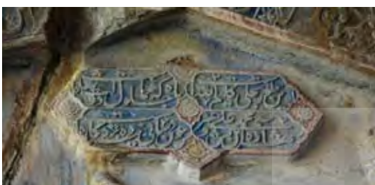
تصویر ۱۷. تصویر کتیبه با شعر بسم‌ل، برجسته، رنگی، دارای ۵ گل برجسته، مأخذ: همان