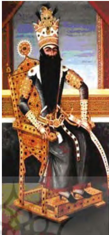
تصویر ۶. چپ: فتحعلی شاه نشسته روی صندلی، منسوب به مهرعلی، تهران، مأخذ: Diba & Ekhtiar, 1998: 182.