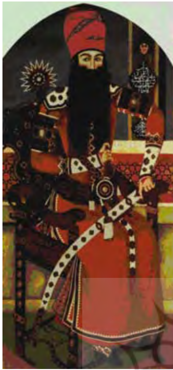
تصویر ۷. راست: چهره شاهزاده محمدعلی دولتشاه امضا جعفر، سال: (۱۲۳۶ هـ.ق)، شیوه: رنگ و روغن روی بوم ساکراگری، محل نگهباری: موسسه سمپتسون (۱۹۹۵ میلادی)، مأخذ: همان ۱۹۰.