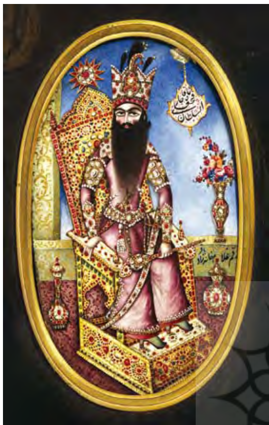
تصویر ۹. تمثال نقاشی شده فتحعلی شاه، تاریخ: اواخر سده ۱۸ و ۱۹ میلادی، امضا: باقر، اندازه: نقاشی با قاب ۶۸ در ۶۹، نقاشی بدون قاب، ۶ در ۵،۵، مأخذ: www.christies.com .