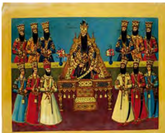
تصویر ۳. فتحعلی شاه و عباس میرزا در کنار هم نقاش: صف سلام نوروزی ۵ ، محل نگه‌داری: مجموعه سلطنتی بریتانیا، شماره اموال: 1005133، مأخذ: www.rct.uk.

خود در آثار هنری به دقت و کرات در تصاویر خود به کار گرفت. در تطبیق چهره «دولتشاه» با «فتحعلی شاه» این موارد را می‌توان در آثار هنری نقاشی (پیکرنگاری)، تمثال و نقش برجسته ملاحظه کرد که در فن، اجرا، قوانین پیکرنگاری درباری تمام موارد با دقت و هدفمند از تصویر «فتحعلی شاه» الگو برداری شده است که در هر بخش مورد بررسی قرار می‌گیرد. تصاویر ۵ و ۴ نمونه‌های نقاشی پیکرنگاری درباری از «فتحعلی شاه» هستند که نشان می‌دهند در نقاشی پیکرنگاری قوانین تصویری دربار تهران در زمینه نقاشی به خوبی و دقت مورد تقلید قرار گرفته است. این قوانین تصویری به صورت اغراق در چهره و اندام، چکیده نگاری، تزیینات فراوان، استفاده از جواهر در تاج، لباس و ملحقات شاه قاجاری است که در تمامی هنرهای وابسته به «فتحعلی شاه» در ابعاد و اندازه‌های متنوع دیده می‌شود.