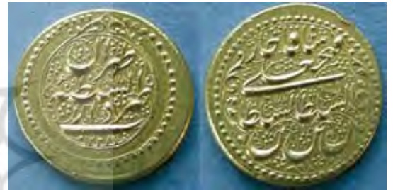
تصویر ۱۱. تمثال نقاشی شده شاهزاده قاجاری، تاریخ: سده ۱۹ میلادی، موضوع: چهره یک شاهزاده با طوطی، قاب بیضی طلاکاری شده، مأخذ: www.reenaahluwalia.com

چهره، هیبت و ظاهر و تاج او متأثر از نقاشی‌های پیکرنگاری درباری قاجار از «فتحعلی شاه» بوده و او تمایل داشت بر این شباهت نیز تأکید شود. این تمثال به شکل اشک بوده و سر «محمدعلی دولتشاه» در مرکز اشک قرار گرفته و دارای ترکیب‌بندی کاملی در عین کوچک بودن تصویر است. پشت این پلاک به صورت ساده بوده و با رنگ آبی فیروزه‌ای پوشانده شده است. جاهایی که رنگ کنده شده نشان می‌دهد جنس آن از طلا بوده و دارای قاب ظریف طلایی با یک سنجاق برای نصب روی لباس طراحی شده است. برای بررسی دقیق‌تر این نشان و شباهت او با چهره و معیارهای زیبایی‌شناسی و قوانین نقاشی پیکرنگاری دربار «فتحعلی شاه» این موارد در جدول ۲ با یک نقاشی «فتحعلی شاه» تطبیق داده شده است.