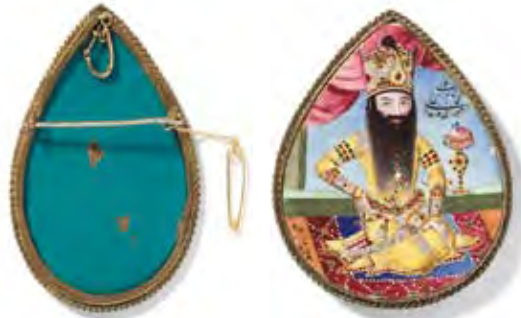
تصویر ۱۴. تمثال نقاشی شده از محمدعلی دولت‌شاه، محل نگه‌داری: مجموعه ساتبیز، لندن، پشت و روی تمثال

متوجه این سطح رنگی شده بود درحالی‌که «رایتلینگر» ۳ نیز در حین توصیف این نگاره، خاطر نشان کرده که «... بر روی آن کماکان نشان از الوان زمخت پدیدار است...»، کتیبه مجاور این صخره نگاره بیان می‌کند که اثر حاضر به دست شخصی با «نام میرزا جعفر» (مانی ثانی) طراحی شده است. این موضوع حاکی از آن است که وی احتمالاً خودش هم نقاش بوده، درباره این شخص اطلاع بیشتری موجود نیست (فلور، ۱۳۹۵: ۱۸۵).