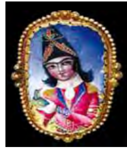
تصویر ۱۱. تمثال نقاشی شده شاهزاده قاجاری، تاریخ: سده هفدهم میلادی، موضوع: چهره یک شاهزاده با طوطی، قاب بیضی طلاکاری شده، مأخذ: www.reenaahluwalia.com

یا جلوه‌گر جمال دولتشاه است شهرزاده محمدعلی آن کش خسرو چو دربانی ستاده بر درگاه است در این شعر، شاعر کوه طاق بستان را به کوه طور و جمال دولتشاه را به جمال حضرت موسی (ع) تشبیه کرده و «خسرو پرویز» را دربان «محمدعلی دولتشاه» معرفی کرده است. در سمت راست او «امام‌قلی میرزا» معروف به «عمادالدوله» (تصویر ۱۹)، به حالت ایستاده با صورتی سه رخ و بدنی تمام‌رخ نقش شده است. او دارای ریش کوتاه سیاه‌رنگی است و تاج جواهرنشانی بر سر دارد. لباسش پیراهن گشاد بلندی است که متأسفانه رنگ آن از بین رفته و خنجر و شمشیری در غلاف سمت چپ آن آویخته شده است. در سمت چپ «محمدعلی دولتشاه» پسر دیگرش «محمدحسین میرزا» ۲ نقش شده که متأسفانه جزئیات صورت وی از بین رفته است. تاج او از نوع تاج‌های کنگرهدار و لباسش از پیراهن سبزرنگ بلندی است که بر تن دارد و شمشیری در غلاف به حمایلش بسته شده است. در جلو «محمدعلی دولتشاه» با لباس قرمز، آقاغنی به حالت ایستاده با صورت و بدنی