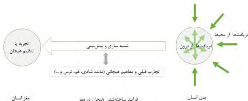
تصویر ۱. فرایند ساخته‌شدن هیجانات در مغز انسان.

براساس نظریه گیبسون (Gibson, 1996)، محیط برای تأمین تجربه‌ها و رفتارهای انسان توان بالقوه‌ای دارد (پای‌کن و همکاران، ۱۴۰۰). اطلاعات محیط از طریق فرایندهای ادراک به دست می‌آیند که برلین (Berlyne, 1974) ادعا می‌کند ادراک محیط فرایندی است که از انتقال اطلاعات، به واسطه کشمکش و عدم قطعیت محیط به دست می‌آید. او مؤلفه‌های پیچیدگی، تازگی، ناهمخوانی و شگفت‌انگیزی را متغیرهای تطبیقی محیط می‌نامد که در ناظر حس لذت و خوشی، پاداش، جذب و باز خورد مثبت را برمی‌انگیزد. در مجموع، مردم خواهان محیط‌هایی هستند که در ابتدا سطح اطلاعات محیطی متوسطی دارند؛ زیرا کمبود اطلاعات محیطی (همگونی و یکنواختی بیش از حد) موجب دلزدگی و کسالت شده و فراوانی اطلاعات محیطی (اغتشاش و تنوع بیش از حد) منجر به خستگی ذهنی و واماندگی روانی می‌شود و دوم آن که تأثیر لذت‌بخش بر آنها بگذارد (پای‌کن و پورجعفر، ۱۳۹۸). آلتمن و ولویل (Altman & Wohlwill, 1976) بیان می‌کنند مکان‌هایی که ما در آن زندگی می‌کنیم، اعم از چشم‌اندازهای شهری، ساختمان‌ها یا محیط‌های طبیعی، به‌طور مستقیم بر هیجان و در نتیجه سلامت انسان تأثیر می‌گذارند. اولریخ و همکاران (Ulrich et al., 1991) به جذابیت و احساس مثبت انسان‌ها نسبت به عادت‌ها، فعالیت‌ها و تمام عناصر طبیعت اطراف اشاره دارند. از دیدگاه اپلتون (Appleton, 1975) انسان‌ها تمایل به فضاهای بزرگ و با حفاظت دارند. نسر (Nasar, 2011) پنج عامل را بر دوست‌داشتن مکان مؤثر می‌داند: طبیعی بودن، نگهداری مناسب، فضاهای باز، اهمیت تاریخی و نظم. فرانز (Franz, 2005) بیان می‌کند بین وسعت مکان و ارزیابی عاطفی