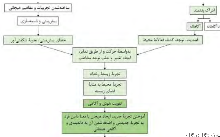
تصویر ۲. چگونگی ساخته شدن هیجان.

مفهوم و مفهومی هیجانی، تجربه و تجربه هیجانی و آگاهی و آگاهی هیجانی نیز با هم تفاوت‌هایی دارند. وقتی از مفهوم هیجانی و پردازش معنی آن در ذهن افراد صحبت می‌شود، این پردازش معنی، پردازش معنی واژگانی مطرح در زبان‌شناسی نیست؛ بلکه بیشتر جنبه ذهنی‌تری یعنی معنی عاطفی یا هیجانی مدنظر است. با توجه به بی‌همتای بودن تجارب یادگیری هر فرد، بار هیجانی مفاهیم برای یک شخص در مقایسه با دیگری می‌تواند واگرا و متفاوت باشد و معانی یا مقاصد مختلفی را القاء کند (عیسی‌زادگان، ۱۳۸۸).