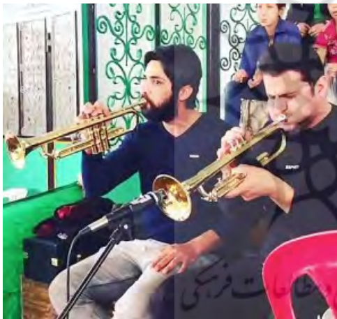
تصویرهای ۶ و ۷. اجرای سازهای بادی قدیمی و بدوی.

مثال بارز دیگر، بازسازی صحنه ورود اشخاص و یا آغاز نبردهاست که عموماً در آن از سازهای کوبه‌ای نظیر طبل استفاده می‌شود و یا هنگام وقوع صحنه‌های حزین و غمبار که از سازهای بادی برنجی مثل ترومپت یا بادی چوبی نظیر نی و کلارینت استفاده می‌گردد. یا این‌که وقتی طبلی در تعزیه نواخته می‌شود، طبق سنت نهفته در آن تماشاگر