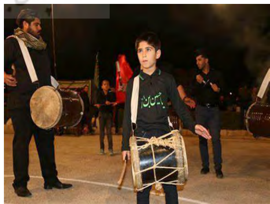
تصویر ۲۰. دمام زیر غمبیر.