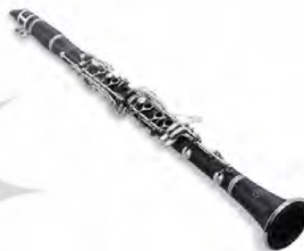
تصویر ۲۴. کلارینت یا قره‌نی.

سازای چوبی و مخروطی شکل است. سرنای تعزیه دوزبانه و طول لوله‌اش تقریباً نیم‌متر است که ۶ سوراخ در یک ردیف و سوراخی در جهت مخالف دارد. نواختن این ساز در بیشتر نواحی کشور، به خصوص در روستاها معمول است. از سورنا برای اجرای ملودی‌های شاد و غمگین هم به صورت ریتمیک و هم به صورت آوازی استفاده می‌شود. سورنا علاوه بر نقش تک‌نوازی قابلیت گروه نوازی را نیز دارد.