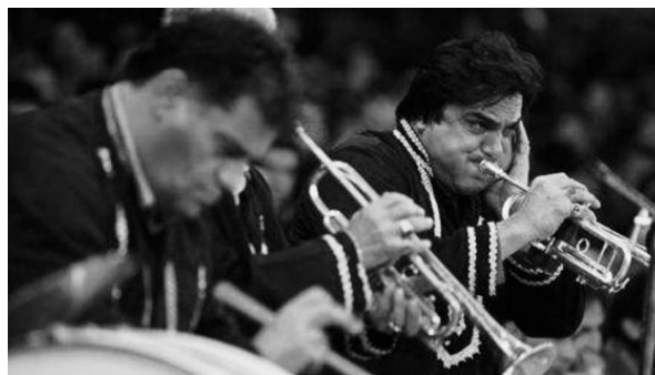
تصویر ۹. هم‌نوازان سازهای بادی.