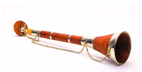
تصویر ۲۶. سورنا یا سورنای.