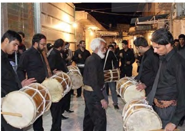
تصویر ۱۷. گروه دمام.

که منظور دو دمامی است که بعد از دمام اشکون روبه‌روی