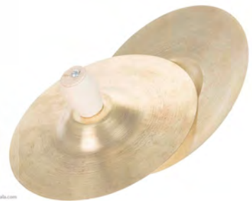
تصویر ۱۵. سنج یا سنج.

دو طبل کوچک متصل یا جدا از هم است؛ یکی با دهانه‌ای بزرگ‌تر با صدای بم‌تر و دیگری با دهانه‌ای کوچک‌تر با صدایی زیرتر. نقاره را با دو عدد ترکه که به چوب نقاره معروف است، می‌نوازند. گاه یک چوب فقط به قسمت بم و چوب دیگر فقط به قسمت زیر ضربه می‌زند و برخی اوقات هم هر دو چوب به هر دو قسمت اصابت می‌کند. کاربرد اصلی نقاره در نقاره‌خانه‌های شهرهای بزرگی بوده است که در آن‌ها به هنگام طلوع و غروب آفتاب نقاره می‌زدند (نوبت‌نوازی). افزون بر این، در مراسم دسته‌گردانی و عزاداری نیز به کار