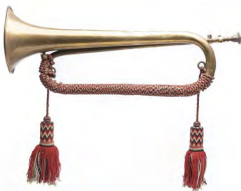
تصویر ۲۱. شیپور.