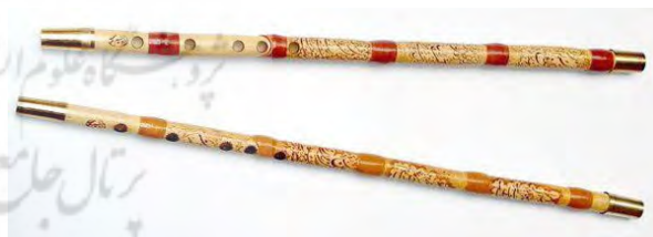
تصویر ۲۵. گروه نوازندگان ترمپت.