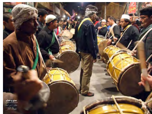
تصویر ۱۱. گروه نوازندگان دمام.

در هنر موسیقی مراد از سازشناسی، علم بررسی، طبقه‌بندی و شناخت ویژگی‌های سازهای موسیقی است که در آن مباحثی چون شناخت ساختمان ساز، مکانیسم صدادهی، دسته‌بندی، محدوده صوتی، محدودیت‌ها،