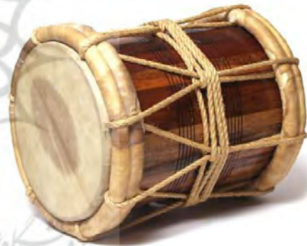
تصویر ۱۸. دمام اشکون.

سازی از جنس برنج یا مس و بدون پیستون و از