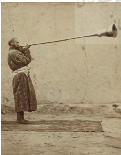
تصویر ۲۷. کرنا یا کرنا.