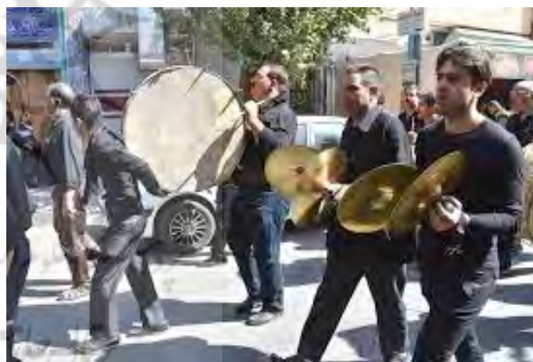
تصویر ۸. هم‌نوازی حین دسته‌روی.

د. قابلیت اجرا در حین حرکت و دسته‌روی از دیگر مشخصه‌هایی است که سازهای تعزیه لازم است دارا باشند. ه. عدم حرمت از نظر فقها و همین‌طور شکل و ظاهر ساز و پیشینه‌ای که در ذهن عامه مردم داشته، جواز استفاده و به کارگیری از آن را رقم می‌زده است. و. اغلب سازهای تعزیه عیناً و دقیقاً همان سازهای میدان جنگ و کارزار واقعی هستند و این خود نوعی قرینه‌سازی مابین شبیه‌خوانی و صحنه واقعی نبرد را رقم می‌زند. ز. جنس صدای ساز به خصوص سازهای بادی که فی‌نفسه به لحاظ ساختاری در شنونده القای حزن و یا رعب