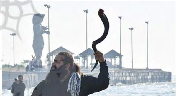
تصویر ۲۹. بوق.

بوق، سازی ویژه در بین سازهای محلی و بومی منطقه جنوب است. که بنا به اظهارات بزرگان و ریش‌سفیدان در ابتدا در توسط مردم جنوب ایران خصوصاً بوشهر برای آیین عزاداری امام سوم شیعیان یا دیگر بزرگان دینی نواخته می‌شده است. نحوه نوازندگی این ساز دارای قانون و قاعده خاصی نیست و فرد نوازنده با دمیدن شدید بر سوراخ کوچکی در انتهای باریک ساز، صدای آن را درمی‌آورد که اگر تبحر داشته باشد، بین دو تا سه نت موسیقی را می‌تواند تولید کند. در ابتدا و انتهای نواخت سنج و دمام بوق زده می‌شود و در حین اجرای سنج و دمام این ساز بداهه‌نوازی می‌کند. تعداد دفعات نوازندگی و اجرای آن را رهبر گروه مشخص می‌کند. بوق یک سوراخ در ابتدای لوله (محل دمش) و یک سوراخ خروجی در انتها لوله صوتی خود دارد. در نتیجه نمی‌توان انتظار داشت همانند دیگر سازهای ملودیک، بتواند ملودی‌های گوناگونی تولید کند.