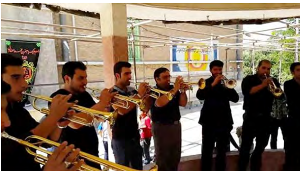
تصویر ۲۳. گروه نوازندگان ترومپت.

اندک‌اندک از ترومپت به جای شیپور ساده قدیمی، نه‌تنها در تکیه دولت و تک‌ایای اعیان و اشراف، بلکه در بعضی از تکیه‌ها و تعزیه‌خوانی‌های عمومی هم استفاده شد. از آنجاکه ترومپت دارای پیستون بود، نوازندگان می‌توانستند با سهولت و کیفیت بیشتر نغمه‌ها، آهنگ‌ها و گوشه‌ها را بنوازند. با ورود ترومپت، نوعی تحول در موسیقی تعزیه پدیدار شد. نوازندگانی که در نواختن ترومپت و بوگل پیستون‌دار، تبحر و ورزیدگی داشتند، در بسیاری موارد، تعزیه‌خوانان را در آوازخوانی نیز همراهی می‌کردند و عیناً همان گوشه‌ها و نغمه‌هایی را می‌نواختند که تعزیه‌خوان (اولیاخوان) می‌خواند. ترومپت