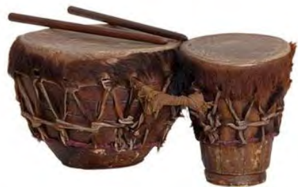
تصویر ۱۶. نقاره.