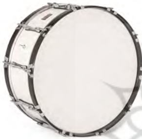
تصویر ۱۲. طبل بزرگ.

سازی است کوبه‌ای در ابعاد مختلف بزرگ و کوچک،