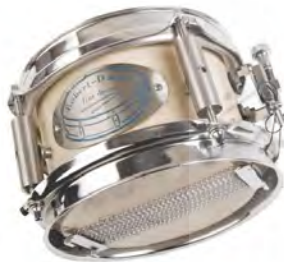
تصویر ۱۳. طبل کوچک (ریز).