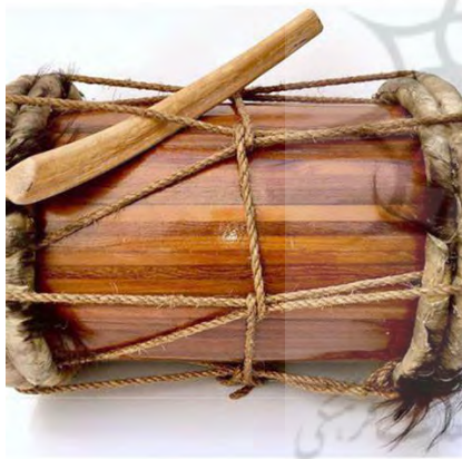
تصویر ۱۹. دمام غمبیر.

سازی است فلزی و دوزبانه مانند ترومپت. لوله‌اش کله‌قندی و کوتاه‌تر از ترومپت است. شکل کلیددار آن در قرن ۱۹ میلادی ساخته شد. بوگل دو نوع است؛ بوگل بزرگ و کوچک. تفاوت بین این دو در وسعت صدای حاصله است.