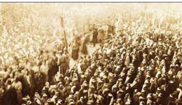
تصویر ۲. تکیه دولت.

اما علاوه بر استفاده از موسیقی ردیف، گستره‌ای از الحان موسیقی مقامی و نواحی از جمله بختیاری، بیدگانی، غربتی، سرکوهی، دشتستانی و فائزخوانی و مجموعه‌ای از تصانیف و ترانه‌ها در مایه شوشتتری نیز در تعزیه و به‌موازات آن ردیف دستگاهی استفاده شده است که خود گویای بهره‌گیری موسیقی ردیف از تمامی ظرفیت‌های موجود و در دسترس آن دوره بوده است. به‌عنوان مثال در شمال کشور نغمه‌های بومی همچون گیلکی، دیلمانی و همچنین در سمنان نغمه سرکوبری در مجالس تعزیه مورد استفاده قرار می‌گرفته است. گاهی هم با الحانی مواجهیم که صرفاً جنبه مذهبی و تقدس‌آمیز دارند و به تعزیه راه یافته‌اند: «نمونه‌های این‌گونه نغمات نیز بسیارند که حقانی‌های دامغان و سبزوار،