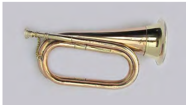
تصویر ۲۲. ترومپت پیستون‌دار