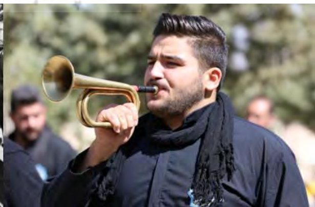
تصویر ۴. تکیه دولت.