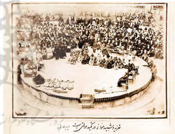
تصویر ۴. تکیه دولت.