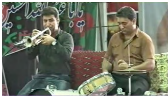
تصویر ۱۰. هم‌نوازی نوازندگان ترومپت، طبل ریز و سنج.