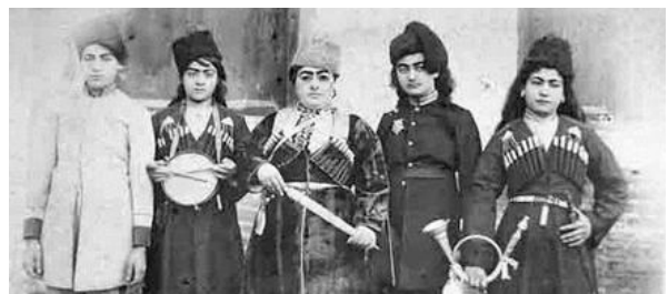
تصویر ۳. دسته تعزیه گردانی زنانه.

در نهایت اشاره به ویژگی بارز دیگری از موسیقی تعزیه که از موسیقی ردیف و اساساً موسیقی روز آن دوره اقتباس و تقلید شده ضروری خواهد بود و آن مرکب‌خوانی است