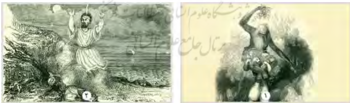
شکل ۱.۲. دیو دوال پا اثر ویلیام هاروی، ۱۸۳۸م. ۲. غول محبوس در کوزه اثر فردریش، ۱۸۳۰م.

در ادبیات دوره اسلامی و فرهنگ عامه مردم ایران، پریان، غولان و در فرهنگ عربی جن‌ها، گزینه‌های تازه‌ای برای خیال‌پردازی بودند و طی فرآیندی زیبایی‌شناسانه وارد خیال‌پردازی ایرانی شدند. این نقطه عطفی در تاریخ تحول چهره دیو و دیگر موجودات فراطبیعی همچون پری در ادبیات ایرانی بود؛ فرآیندی که می‌توان آن را زیبایی‌شناسانه‌کردن امر هیولایی نامید. خیال‌پردازی در ایران با هیولاها جان می‌گیرد و این موجودات فراطبیعی در افزودن عنصر شگفتی به روایت‌های مکتوب و شفاهی پس از اسلام سهم مهمی دارند (Barati, 2019, 5-6). کتاب هزار و یک شب مجموعه‌ای از داستان‌های عامیانه و افسانه‌ای است که در طول قرن‌ها در خاورمیانه و جنوب آسیا گردآوری شده است. این مجموعه به زبان‌های مختلف ترجمه و در نقاط مختلف جهان شناخته شده است. منشاء اصلی آن قصه‌های هندی مثل پنج‌تنتره ، یتوپادشا و قصه‌های ایرانی مثل هزار افسان است که به زبان پهلوی نوشته شده است. در اواخر قرن دوم هجری، این داستان‌ها به عربی ترجمه و به تدریج با داستان‌های بومی عربی تلفیق شدند. هزار و یک شب ، در طول قرن‌ها، قصه‌ها و داستان‌های جدیدی همچون عاشقانه، ماجراهای پهلوانی، داستان‌های جن و پری و حکایات دینی به آن اضافه شده و این کتاب را به یکی از ارزشمندترین میراث ادبی جهان تبدیل کرده است. در اوایل قرن هجدهم، آنتوان گالاند ۷ ، شرق‌شناس فرانسوی، این داستان‌ها را به زبان فرانسوی ترجمه و به اروپایی‌ها معرفی کرد. این ترجمه‌ها با استقبال زیادی مواجه شد و به سرعت به زبان‌های دیگر اروپایی ترجمه و تصویرسازی شد. (شکل ۲)