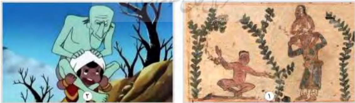
شکل ۶. دیو دوال‌پا، ۱. عجایب‌المخلوقات قزوینی (۶۷۸ه.ق) ۲. انیمیشن سندباد (۱۹۷۵)