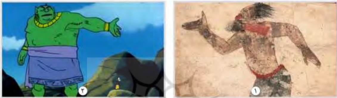
شکل ۷. غول، ۱. عجایب المخلوقات قزوینی (۶۷۸ هـ.ق) ۲. انیمیشن سندباد (۱۹۷۵)

عوج بن عنق، غول‌هایی هستند که قزوینی در مورد آنها داستان‌هایی نقل می‌کند. عوج بن عنق غولی عظیم‌الجثه بود. او از بهترین‌های خلق خداوند بود؛ زیبا، بلند قامت و با عظمت بود که در زمان حضرت نوح (ع) زندگی می‌کرد. اما پس از مخالفت با نوح نبی در کشتی نجات سوار نشد و مورد خشم خداوند قرار گرفت. تا اینکه در زمان حضرت موسی (ع) به دستور خداوند پرنده‌ای مأمور شد که سنگی بر صخره‌ها بیاندازد و صخره‌ها بر گردنش فرو آمدند و عوج معلول شد. موسی (ع) توسط خداوند با خبر شد و او را با عصایش زد و عمر طولانی‌اش را به پایان رساند» (Qazvini, 1279, 328-343).