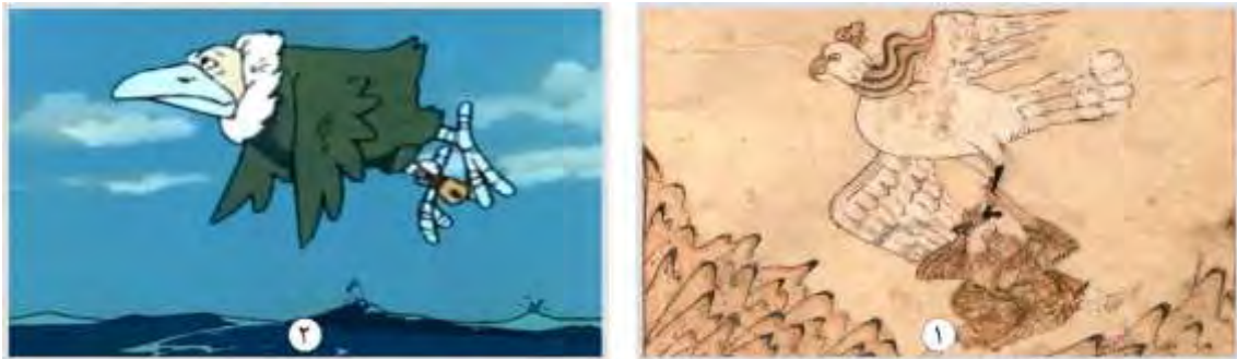
شکل ۵. پرنده گول‌پیکر، ۱. عجایب‌المخلوقات قزوینی (۶۷۸هـ.ق) ۲. انیمیشن سندباد (۱۹۷۵)

موجود دارای چنگال‌ها و نوک بسیار قوی و تیز است که به او اجازه می‌دهد تا به راحتی شکار کند. این موجود گول‌پیکر در جزایر دور و غیرقابل دسترس زندگی می‌کند تا از انسان‌ها دور باشد.