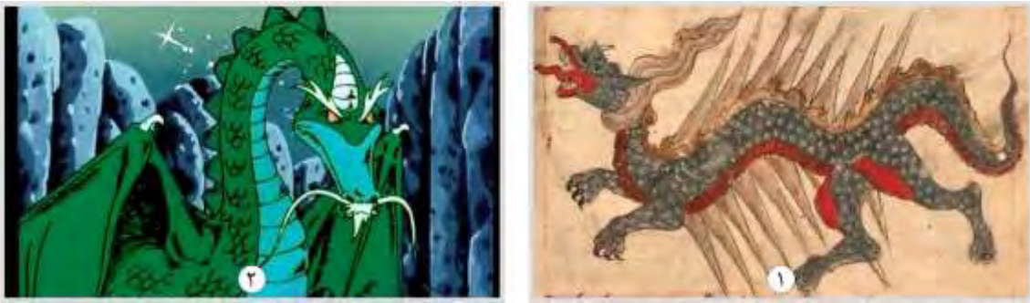
شکل ۹. اژدها، ۱. عجایب المخلوقات قزوینی (۶۷۸ هـ.ق) ۲. انیمیشن سندباد (۱۹۷۵)