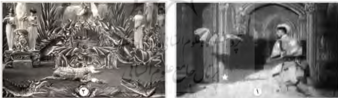
شکل ۱.۱. فیلم خانه شیطان ۲. فیلم شادی‌های شاد شیطان