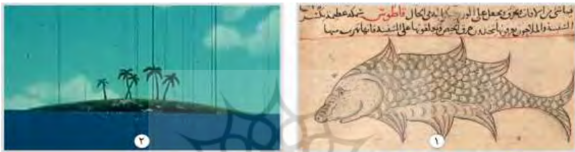
شکل ۴. نهنگ، ۱. عجایب المخلوقات قزوینی (۶۷۸ ه.ق) ۲. انیمیشن سندباد (۱۹۷۵)

آن‌ها زیر و سخت است و دهان بزرگ و پر از دندان‌های تیز دارند. قزوینی همچنین به وجود باله‌های بزرگ و دم قدرتمند این موجودات اشاره می‌کند که آن‌ها را قادر می‌سازد با سرعت در آب حرکت کنند. یکی از داستان‌های معروف در عجایب المخلوقات درباره نهنگی است که توسط ملوانان با یک جزیره اشتباه گرفته می‌شود. ملوانان بر روی پشت نهنگ فرود می‌آیند و شروع به برپایی آتش می‌کنند. اما زمانی که نهنگ حرکت می‌کند، متوجه اشتباه خود می‌شوند و به سرعت فرار می‌کنند. قزوینی همچنین به داستان‌هایی از حملات نهنگ‌ها به کشتی‌های دریانوردان اشاره می‌کند. در این داستان‌ها، نهنگ‌ها کشتی‌ها را به زیر آب می‌کشند و باعث وحشت و نابودی ملوانان می‌شوند.