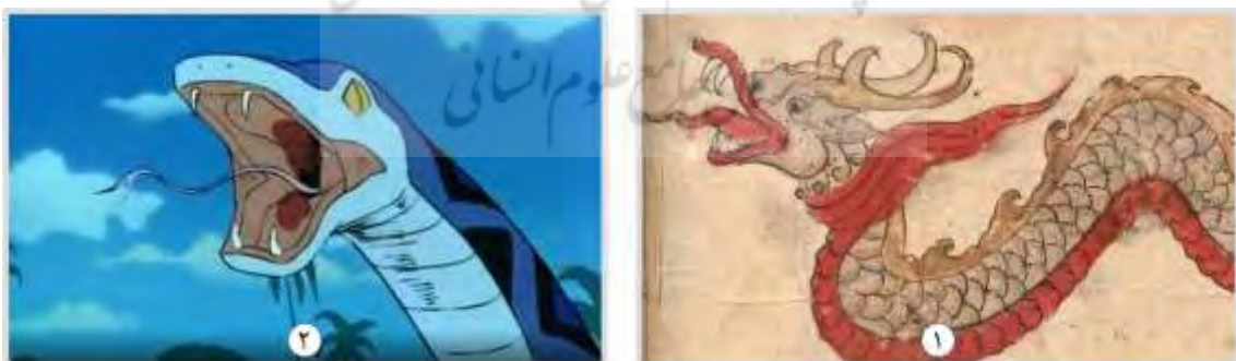
شکل ۱۰. مار عظیم الجثه، ۱. عجایب المخلوقات قزوینی (۶۷۸ هـ.ق) ۲. انیمیشن سندباد (۱۹۷۵)

در شکل ۱۰ تصویر ۱، صفحه ۱۴۹ کتاب عجایب المخلوقات دیده می‌شود که در آن تصویر یک مار عظیم الجثه شبیه اژدها، توسط محمدبن زکریای قزوینی در قرن ششم هجری ترسیم شده است. استفاده از خطوط منحنی و رنگ‌های محدود حکایت از سبک نقاشی برای مصورسازی نسخه‌های خطی آن زمان دارد. این تصویر نمادی از موجودات افسانه‌ای و عجیب است که در داستان‌ها و افسانه‌های قدیمی وجود داشته‌اند. در تصویر ۲ نمایی دیگر از سریال ماجراهای سندباد مشاهده می‌شود. سندباد در قسمت سوم پس از آنکه توسط پرنده گول‌پیکر از جزیره نجات یافته بود وارد جزیره‌ای ناشناخته و ترسناکی می‌شود. در این جزیره با اینکه الماس زیادی روی زمین به وفور وجود دارد اما خلاصی از آنجا غیرممکن است. سندباد در ادامه متوجه می‌شود که مردم بومی منطقه برای به دست آوردن الماس مقدار زیادی گوشت به ته دره می‌انداختند تا الماس‌ها به گوشت بچسبند و توسط پرنده گول‌پیکر به بالا کشانده شوند. اما سروکلۀ ماری عظیم الجثه پیدا می‌شود و پس از کشمکش میان پرنده و مار در نهایت سندباد نجات می‌یابد.