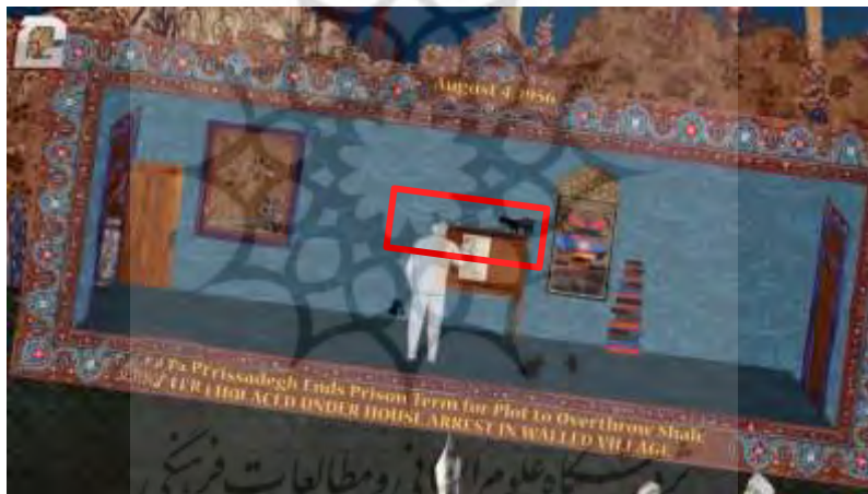
شکل ۷. بخشی از بازی «گربه و کودتا»

گربه دارای نیروهای مرموز است و گاهی نیز مورد پرستش بوده است (Hall, 2021, 89). همچنین گربه نشان دزدانه راه رفتن و نیز، میل و آزادی است (Cooper, 2019, 13)، که نمودی از این ویژگی را می‌توان در بازی حاضر دریافت کرد. گربه سیاه، مربوط به ماه و بدی و مرگ است (Ibid). همان‌طور که در تصویر ۷ مشاهده می‌شود، در بازی «گربه و کودتا»، شخصیت اصلی بازی «گربه» است. در واقع، بازیکن در جایگاه «گربه» در این بازی به شمار می‌رود که در مراحل مختلف بازی، توسط اتفاقاتی که رخ می‌دهد مانند پرت کردن وسایل، به هم زدن کاغذها و چنگ انداختن به دکتر مصدق، وظیفه آگاهی وی از وقایع پیش‌رو را دارد.