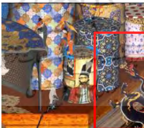
شکل ۳. بخشی از تصویر بازی «گره و کودتا»، مأخذ: آرشیو نگارنده

اژدها در فرهنگ ایرانی که زمینه اصلی شکل‌گیری نمادهای آثار هنری ایرانی- اسلامی را تشکیل می‌دهد، اژدها به عنوان موجودی پلید شناخته می‌شود که تلفیقی از مار و پرنده و به معنای ماده و روح است (Cooper, 2019, 31). اژدها را در دسته خرفستانر گزنده و زهرآگین نیز قرار می‌دهند که توسط اهریمن آفریده شده است. در ادیان توحیدی، اژدها را به مفهوم موجودی شرور می‌دانند (Ibid, 31- 32). نماد اژدها انواعی دارد؛ بدترین نوع اژدها در نگاره‌های ایرانی، اژدهای بسیار سر است و مار، اژدهای دو سر، هفت سر و اژدهای پای‌دار، که جزء خرفستانر زمینی‌اند، از دیگر انواع اژدها به حساب می‌آیند. در روایت‌های پهلوی آمده است که اگر اژدها کشته نشود، همه جهان روشنی را نابود می‌کند (Qolizadeh, 2009, 73). در تصویر ۳ و ۴، بخش‌هایی از بازی «گره و کودتا» مشاهده می‌شود که در آن‌ها نمادی از اژدها مورد استفاده قرار گرفته است.