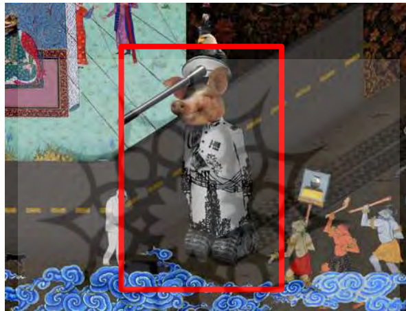
شکل ۶. بخشی از بازی «گربه و کودتا»

یکنواختی شخصیت‌های انسانی در این بازی شده و رنگی تازه به فضا سازی آن بخشیده است. در تصویر ۶، بخشی دیگر از بازی گربه و کودتا مشاهده می‌شود. در اینجا ردای شاه ایران دیده می‌شود که چرخ‌های تانک، جانشین پاهای وی و سر خوک، جانشین سر شاه شده است که بر روی آن کلاه او قرار دارد که لوله تانک از آن بیرون آمده است. نکته قابل توجه این است که بر روی کلاه شاه نیز، عقابی نشسته است. استفاده از نمادهای فوق، در جهت انتقادهای اجتماعی و برای بیان ابراز عقاید در مسائل جامعه است. نسبت دادن خوک، نشئت گرفته از قرآن و آموزه‌های دینی اسلامی است. فلسفه وجودی اسلام و چگونگی ارتباط نماد خوک با مفهوم بازی نمودی از رجس و پلیدی است. خداوند در قرآن کریم می‌فرماید که گوشت این حیوان حرام است و اشاره به نفسی دارد که متعلق به دنیای مادی است (Rezaei & Panahi, 2024, 240). خوک به عنوان یکی از حیوانات منفی در ادبیات فارسی نیز به شمار می‌رود که سمبل شهوت، پلیدی، پستی حرص و... است (Ibid, 239).