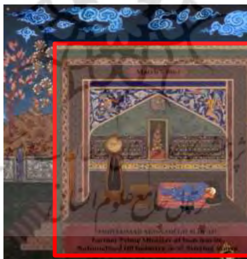
شکل ۲. بخشی از تصویر بازی «گربه و کودتا»

مربع را اغلب نماد زمین، ماده و ثبات می‌دانند (Hall, 2021, 17). تصویر ۲، مرحله ابتدایی بازی «گربه و کودتا» را نشان می‌دهد که در اینجا دکتر مصدق به خوابی ابدی فرو رفته است. ترجمه متن انگلیسی که در زیر تصویر آمده، بیان می‌کند که «دکتر مصدق از دنیا رفته است. نخست وزیر سابق ایران در سال ۸۶ میلادی». همان‌طور که در تصویر ۲ مشاهده می‌شود، دکتر مصدق در کادری مربع شکل قرار گرفته است.