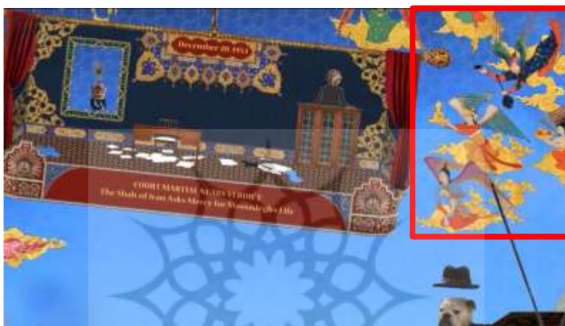
شکل ۵. بخشی از بازی «گربه و کودتا»

پیام‌آوران بالداری هستند که میان خدایان و بشر ارتباط برقرار می‌کنند (Hall, 2021, 260). در تصویر ۵، بخشی از تصویر بازی گربه و کودتا که دارای نقوش فرشتگان بر روی ابرهائی طلایی رنگ است، مشاهده می‌شود. در زیرکادری که فضای اتاق را نشان می‌دهد، متن انگلیسی آمده که چنین ترجمه می‌شود: «حکم دادگاه نظامی نزدیک است: شاه ایران برای جان مصدق طلب رحمت می‌کند». همانطور که از متن برمی‌آید، کادر اشاره شده فضای دادگاه را نشان می‌دهد که دکتر مصدق در دادگاه نظامی محاکمه و علی‌رغم دفاعیه مستندی که از خود ارائه داد، به سه سال حبس انفرادی محکوم شد. در اطراف فضای دادگاه فرشتگانی که بر روی ابرهائی طلایی رنگ قرار گرفته‌اند دیده می‌شود که گویی هر یک از آن‌ها هدایایی در دست دارند.