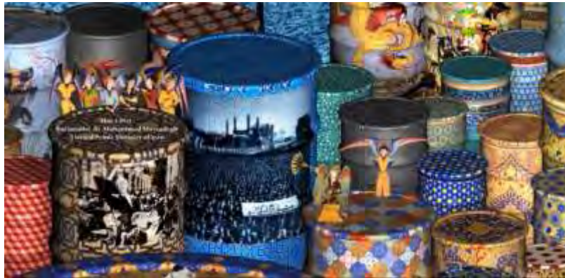
شکل ۱. بخشی از تصویر بازی «گربه و کودتا»، مأخذ: آرشیو نگارنده