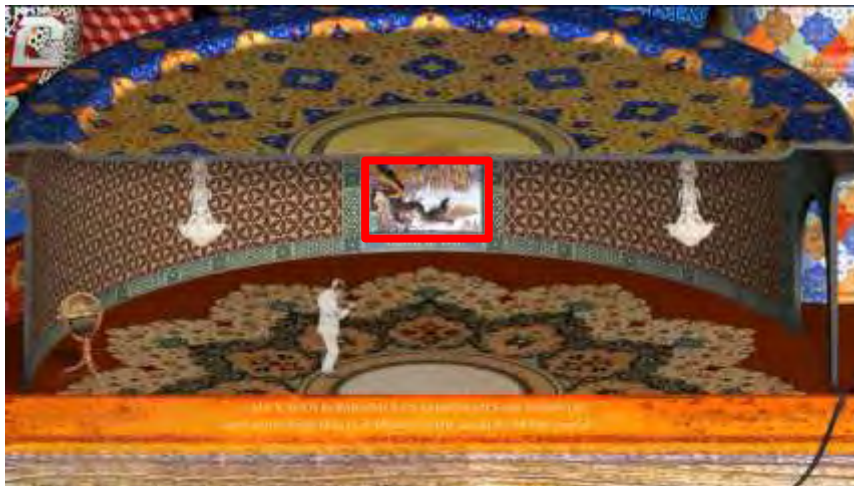
شکل ۴. بخشی از بازی «گره و کودتا»

همان‌طور که در تصاویر ۳ و ۴ مشاهده می‌شود، این مرحله از بازی به زمان ملی‌شدن صنعت نفت، توسط دکتر مصدق اشاره دارد. در بخش پایین تصویر ۴، متنی به زبان انگلیسی آمده که به زبان فارسی چنین ترجمه می‌شود، «مجلس شورای اسلامی، ملی‌شدن صنعت نفت را تأیید کرد و گمان می‌رود که این تهدیدی برای امنیت جهانی است». در تصویر ۳ اژدها در گوشه کادر به رنگ مشکی آمده که آتش از دهانش به سمت بشکه‌های نفت فوران کرده است. در فرهنگ ایرانی از رنگ سیاه به‌عنوان نمادی منفی و به‌معنای غم و سوگواری یاد می‌شود (Asgari & Eghbali, 2013, 59). همچنین، در فرهنگ و هنر ایرانی، اژدها نمادی از شرّ و بدی نیز محسوب می‌شود که دارای طبیعتی رام‌نشده است و نبرد با آن، به‌نوعی دست‌یابی به چشمه حیات بخش است (Kafshchian Moghadam & Yahaghi, 2021, 70). در اینجا اژدهای سیاه‌گون در بخشی از دوره ملی‌شدن نفت، به شناخت بیشتری از جریانات و مبارزات اشاره دارد و با توجه به قرارگیری دهان اژدها به سمت بشکه‌های رمزگونه نفت در بازی حاضر، می‌تواند اشاره به وجه منفی این نماد و دشمنان خارجی از جمله انگلیس و آمریکا داشته باشد. ارتباط و پیوند رهبری نهضت ملی توسط دکتر مصدق و مبارزه او علیه استعمار، نیروی مؤثری در روند بازی ایجاد کرده است. در تصویر ۴ نیز سالی به نمایش گذاشته شده که در مرکز آن تصویر اژدهای دیگری به رنگ سیاه و در حالت برافروختن آتش است که تأکیدی بر مفهوم اشاره شده دارد.