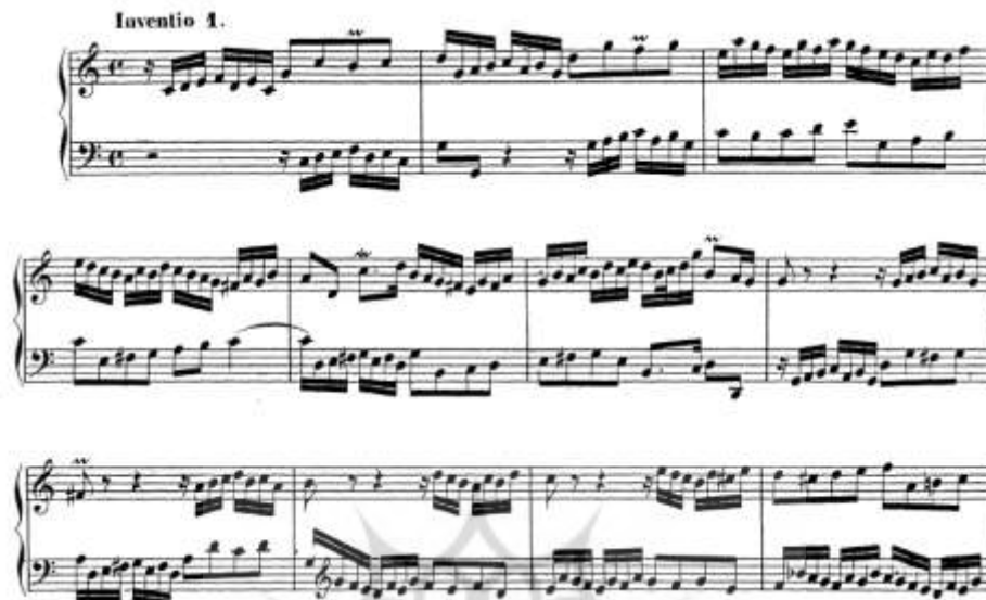
شکل ۴. قسمت ابتدایی از انونسینو شماره ۱، اثر باخ برای ساز کلاویه‌ای (1, 1853, Becker)

شکل‌دهی به گفت‌وگوی عبارت‌ها به صورت سکوت چنگ به سیاه به دولاچنگ شنیده می‌شود که حالت سؤال و جواب را بین دو خط صدایی ایجاد کرده است.