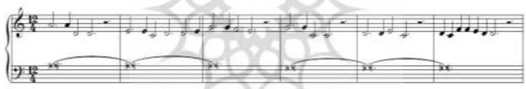
شکل ۲. ابتدای قطعه این روزها، اثر لئونن، بازنویسی شده برای ارگ (Aboyan, 2002, 1)

آشکارترین کارکرد سکوت در موسیقی، مشخص کردن آغاز و پایان عبارت‌ها است و از اولین نمونه‌های موسیقی کلاسیک غرب می‌توان ردپای آن را شنید؛ مثلاً در شکل ۲ که ابتدای قطعه این روزها ۲۱ از لئونن ۲۲ به عنوان آهنگساز قرون وسطی دیده می‌شود، سکوت سفید نقطه‌دار همچون نقطه در نوشتار، جداکننده عبارت‌های موسیقایی است و نقش حدفاصل خود را در انتها و ابتدای آنها نشان می‌دهد.