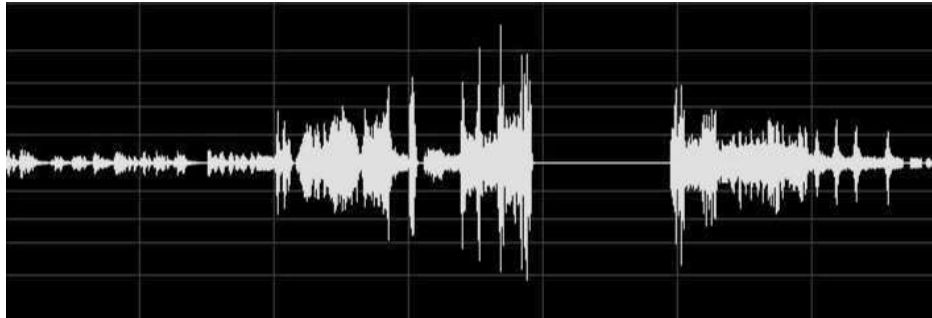
شکل ۱. نمودار موج صوتی موومان سوم از قطعه چهاردیواری، اثر کیچ، تولیدشده با نرم‌افزار ادوبی آئودیشن توسط مؤلف

در این نمودار محور افقی زمان و محور عمودی شدت صداست و خط ممتد، سکوت با طول زمانی زیاد را مشخص می‌کند. بررسی نشان می‌دهد که طول زمانی این موومان تقریباً هفت دقیقه و طول زمانی سکوت حدوداً یک دقیقه است که چنین استفاده‌ای از سکوت، پیش از کیچ رایج نبوده است. البته برای دریافت یک معنا و مفهوم ممکن از این موومان قطعه چهاردیواری متناسب با مطالعه‌ی پساساختارگرایانه، به ارتباط بینامتنی و شناخت نقش سکوت و چگونگی صدا در موسیقی‌های پیرامونی دیگر نیاز است؛ یعنی کیفیت موسیقایی چنین قطعاتی بر اساس موسیقی بودن قطعاتی دیگر از بطن رپرتوار موسیقی مربوط، مشخص و تعریف می‌شود که می‌تواند متعلق به همان آهنگساز باشند یا از گونه‌ای مشابه و حتی متضاد انتخاب شده باشند.