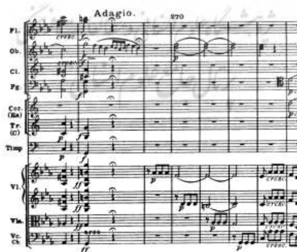
شکل ۶. کارکرد سکوت برای ایجاد تنش، قسمتی از موومان اول سمفونی پنجم، اثر بتهوون (Unger, 1976, 139)

این کارکرد سکوت تاحدی در ارتباط با تنش نمایشی حاصل از سکوت در اُپراست که قبلاً به آن اشاره شد. البته تنش در موسیقی متأثر از سایر عناصر صدایی هم می‌تواند روی دهد؛ مانند اینکه سازی خاص در یک اثر ارکستری برخلاف جریان هارمونی بنوازند و درحقیقت نوعی تضاد هارمونیک فاحش را با بقیه سازها به گوش برسانند و از این طریق با نشان دادن نوعی از تک‌گویی و انزوا، بر تنش احساسی موسیقی بیفزایند. اما متناسب با موضوع مورد بحث، استفاده خاص از سکوت می‌تواند به خوبی کاهش و افزایش تنش را به همراه داشته باشد؛ مثلاً سکوت در زمانی که کاملاً انتظار شنیده شدن یک اتفاق صدایی وجود دارد می‌تواند اشتیاق نسبت به ادامه شنیدن را افزایش دهد و پیش‌بینی جریان موسیقی را در ذهن شنونده آورد.