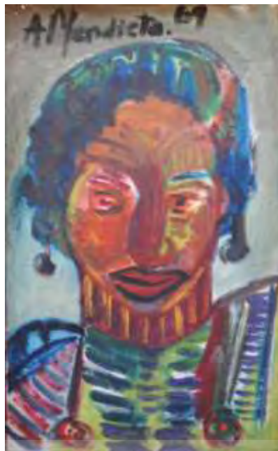
تصویر شماره ۱. پرتره بدون عنوان (پرتره زنی با پوست قهوه‌ای)، منبع: (Alvarado, 2015, 69).

این اثر یکی از معدود نقاشی‌هایی است که پس از درخواست آنا مبنی بر این‌که تمام بوم‌های باقی‌مانده‌اش پس از رها کردن نقاشی از بین برود، سالم مانده است. در این پرتره، مدل نقاشی که مادر مندیتا بوده به شکل قابل تأملی قهوه‌ای کشیده شده است. این موضوع باعث وحشت مادر شد و شکایت او را در پی داشت که «آنا وی را شبیه به شیطان نقاشی کرده است» (Herzberg, 1998, 69). مندیتا در این نقاشی به وضوح در نقش یک دانشجوی تاریخ هنر بوده و رنگ‌گذاری‌های او ملهم از مکتب آوانگارد فرانسوی، یعنی فوویسم ۱۴ (ددگرایی)، است. آنا مندیتا در یکی از نوشته‌هایش به منبع این جادو اشاره می‌کند: «تصمیم گرفتم برای اینکه تصاویر ویژگی‌های جادویی داشته باشند، باید به منبع آن مراجعه کنم: زندگی» (Finkelstein, 2012, 7).