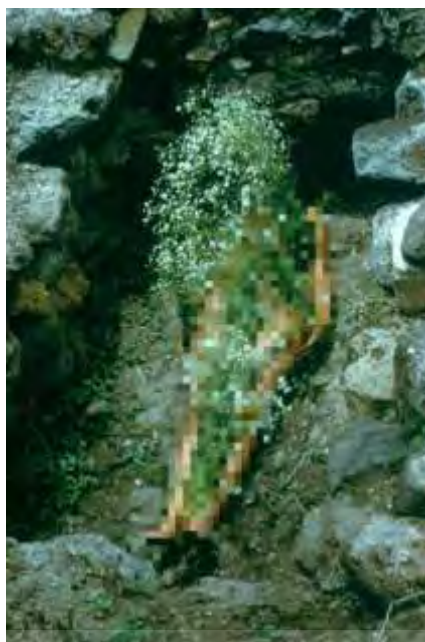
تصویر ۲. «تصویری از یاگول» از مجموعه سیلوئتا (۱۹۷۳).

مجموعه سیلوئتا از آنا مندیتا، با پیروی از اصول بنیادین دهه هفتم قرن بیستم و مسئله‌سازی اثر هنری به عنوان یک گزاره بی‌پایان، از بدن زن به عنوان هسته خلاقیت خود بهره می‌گیرد (Pavleska, 2021, 290). مندیتا از این مجموعه با تعبیر «تجسم بدن به عنوان امتداد طبیعت و طبیعت به عنوان امتداد بدن» یاد می‌کند (Best, 2007, 73).