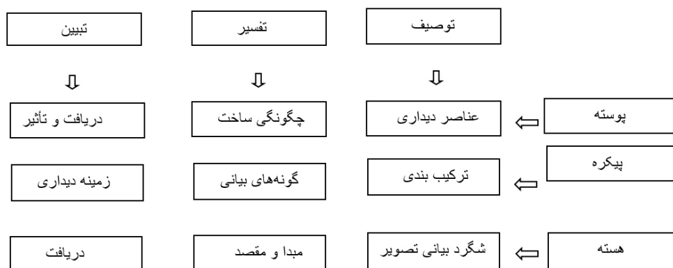
شکل ۲. توصیف دیدمان تصویر