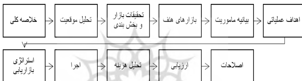
شکل ۱. مراحل و اصول کمپین تبلیغاتی موفق

برای خلق یک کمپین تبلیغاتی موفق اولین قدم تهیه یک خلاصه کوتاه و اجمالی است از کل برنامه بازاریابی و نکاتی که باید در هر بخش ارائه شود. در قدم بعدی تحلیل موقعیت انجام شده و محیط داخلی و خارجی بررسی می‌شود. مرحله سوم تحقیقات بازار و بخش‌بندی تعیین بازارهای هدف است. بیانیه مأموریت در مرحله بعدی مطرح می‌شود که برنامه بازاریابی را با مأموریت سازمانی یا برنامه استراتژیک همسو می‌کند. اهداف عملیاتی و استراتژی‌های بازاریابی که کدام بازارها و با چه استراتژی باید مورد توجه قرار بگیرد. در مرحله بعدی به اجرا رسیده و در مرحله بعدی با تحلیل هزینه و ارزیابی انجام شده ایرادات احتمالی مورد اصلاح قرار می‌گیرد (موسوی، ۱۳۹۹: ۲۰) (شکل ۱).