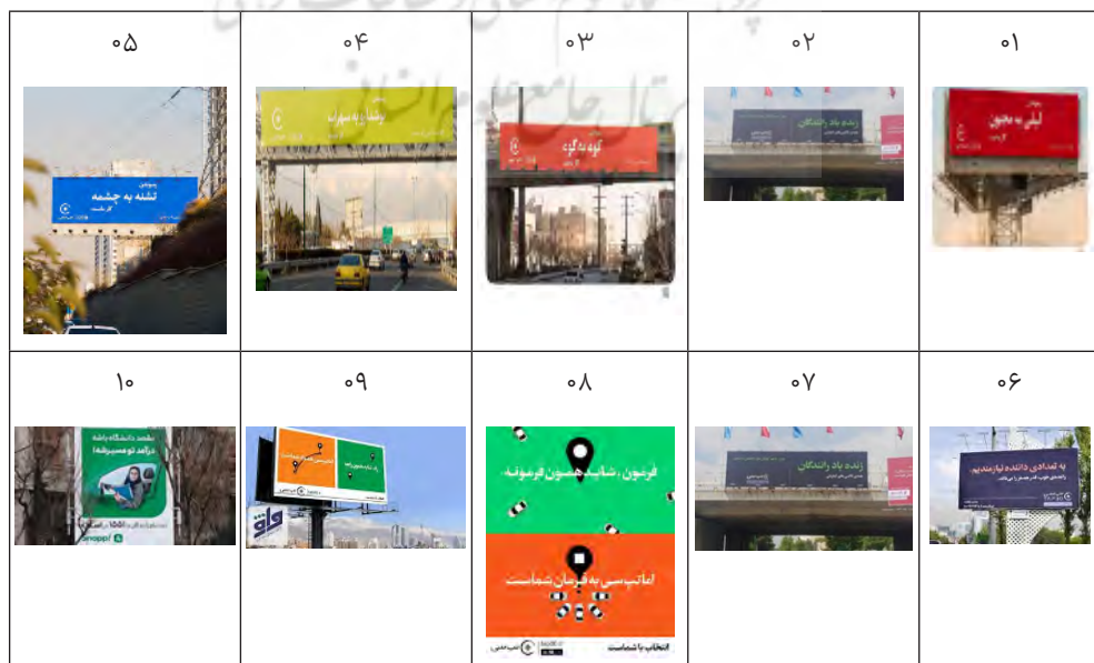
جدول ۷. کد نگاره‌ها