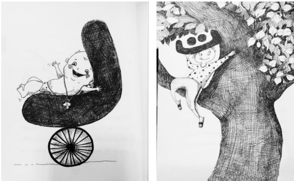
تصویر ۵. کتاب «قصه‌های الفبا»، محمدرضا شمس، ۱۳۹۵، انتشارات هوپا

در کتاب «قصه‌های الفبا» حروف به صورت دست‌نویس نوشته شده‌اند که چندان خوانا نیستند و به سختی می‌توان شکل حروف الفبا و رابطه با عناصر بصری موجود با صفحه را پیدا کرد. در کتاب «الفبای فارسی»، فونت انتخابی مناسب و خواناست اما نسبت به صفحه بسیار کوچک است و حتی رنگی متفاوت با عناصر بصری ندارد تا موجب تثبیت شکل حروف الفبا همراه با مثال آن در ذهن کودک شود. در بررسی این آثار استانداردهای تصویرسازی مناسب سن کودک مذکور رعایت نشده است. ابزار و تکنیک استفاده تصویگر، مناسب نیست و از نگاه پیاژه به ویژگی‌ها و نیازهای مخاطب و گروه سنی آن توجه چندانی نشده است. در این کتاب‌ها فعالیت‌های بازی‌گونه که امکان رفتارهای رفت و برگشتی را شکل دهد و کودک را درگیر تعامل با کتاب کند دیده نمی‌شود و هیچ فعالیتی برای او تعریف نشده است تا با تغییر اشیا سعی کند به وسیله دو فرایند درون‌سازی و برون‌سازی محیط خود را درک کند و آموزش مؤثر اتفاق بیفتد. همچنین با وجود ضعف در تصویرسازی، تجسم و به خاطر سپردن تصاویر و شکل حروف اتفاق نمی‌افتد.