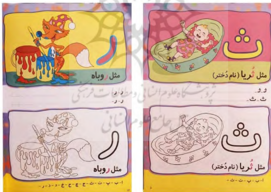
تصویر ۱۷. کتاب «آشنایی با الفبای فارسی همراه با رنگ‌آمیزی»، علیرضا کریمی، ۱۳۹۵، کودک و نوجوان انتشارات عارف کامل (کتاب‌های فیل و فنجون)

کتاب «آشنایی با الفبای فارسی همراه با رنگ‌آمیزی» (تصویر ۱۷) با تصویرگری علیرضا کریمی است. در تصویرسازی این کتاب از تکنیک دیجیتال استفاده شده که در آن طراحی‌های ضعیف، عدم استفاده از بافت و ویژگی‌های خطی مناسب، فرم‌های تکراری در انیمیشن‌های رایج به چشم می‌خورد. فونت حروف الفبا و ابعاد آن‌ها در این کتاب مناسب است. تنها ویژگی این کتاب، رنگ‌آمیزی است که آن هم به شکل درست و جذاب برای کودک طراحی نشده است. پیازه می‌گوید: «هنگامی که چیزی را به کودکی می‌آموزید، شانس اینکه خودش آن را کشف کند از او می‌گیرید». در بررسی این اثر از منظر پیازه، داشتن فعالیت‌هایی نظیر رنگ‌آمیزی می‌تواند ویژگی مثبت باشد، اما الگوبرداری رنگ‌آمیزی از تصویر رنگ‌شده کتاب فعالیت مثبتی محسوب نمی‌شود و بعد از رنگ‌آمیزی تصاویر کتاب، عدم جذابیت تصویرسازی این کتاب موجب می‌شود که کودک تنها یک بار از آن استفاده کند؛ از این رو آموزش و تعامل فعالانه‌ای با کتاب رخ نخواهد داد و فعالیتی بازی‌گونه که امکان رفتارهای رفت و برگشتی وجود داشته باشد، شکل نمی‌گیرد. از آنجایی که در این اثر تصویرسازی هم به شکل ضعیفی انجام شده، به خاطر سپردن و یادگیری نیز در سطح پایینی اتفاق می‌افتد.