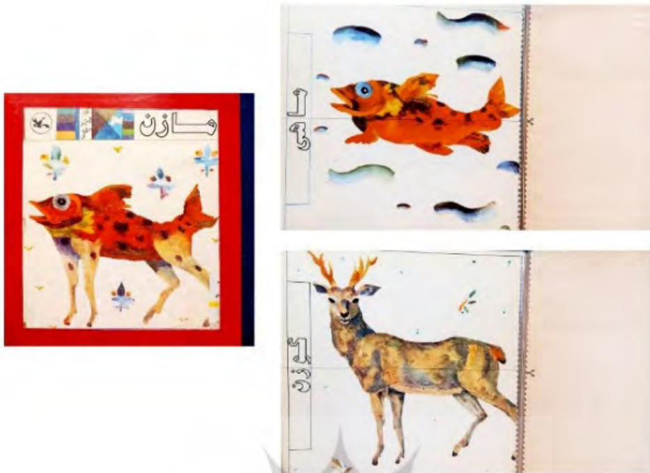
تصویر ۳. کتاب «مازن»، فرشید مثقالی، ۱۳۶۶، انتشارات کانون پرورش فکری کودک و نوجوان

کتاب‌های «مازن» (تصویر ۳) با تصویرگری فرشید مثقالی و «آمثل آهو» و «ف مثل فیل» (تصویر ۴) با تصویرگری علی خدایی علاوه بر نکات مثبت بالا از لحاظ تصویری، آموزش همراه با بازی دارند. مهم‌ترین ویژگی این کتاب‌ها از منظر پیازه، طراحی بازی‌گونه آن‌هاست، باید به کودک امکان جست‌وجو و کاوش داد و هیچ موقعیتی بهتر از بازی چنین فرصتی را به کودک نمی‌دهد.