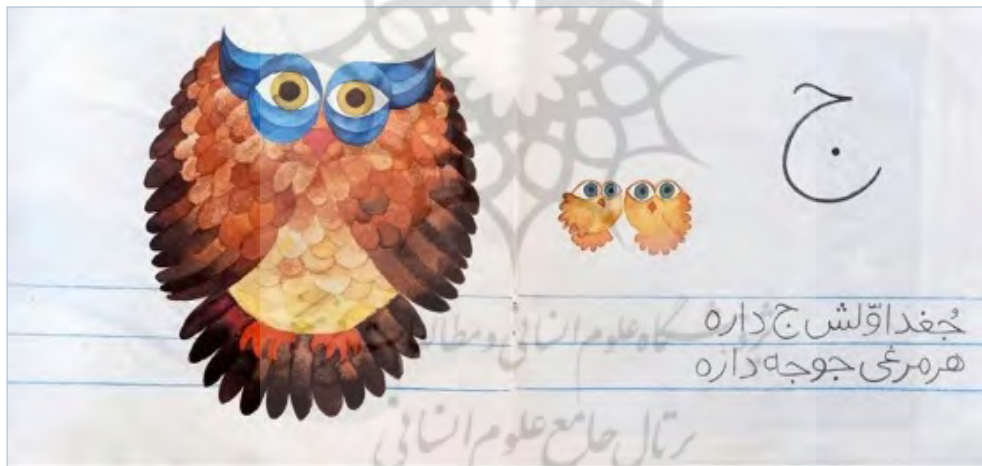
تصویر ۱. کتاب «آاول الفباست»، نورالدین زرین‌کلک، ۱۳۸۷، انتشارات نظر

در کتاب‌های «قصه‌های الفبا» و «بازی با آواها، بازی با الفبا» (سه جلدی) آموزش همراه با داستان، «آمثل آهو»، «ف مثل فیل» و «مازن» آموزش همراه با بازی، «آموزش الفبا (به کودکان بیاموزیم)» و «الفبای فارسی» آموزش فقط با تصویر، «شهرک الفبا»، «آموزش الفبا» و «آاول الفباست» آموزش همراه با شعر است.