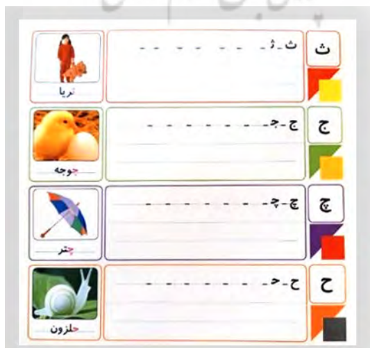
تصویر ۱۱. کتاب «وایت‌برد آموزش الفبای فارسی و اعداد»، بهرام بیدگلی، ۱۳۸۵، انتشارات جهان پویش