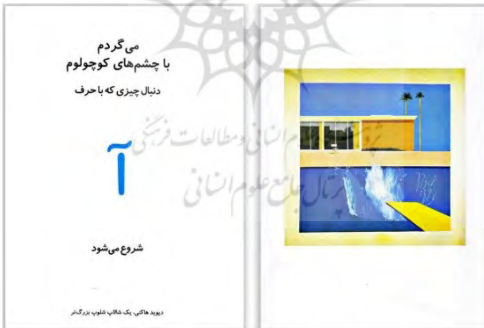
تصویر ۱۳. کتاب «الفبا در هنر»، لوسی میکلت ویت، ۱۳۸۸، انتشارات نظر

در تصویرگری کتاب «الفبا در هنر» (مجموعه نگاه کن) - (تصویر ۱۳) به نویسندگی لوسی میکلت ویت، از تصاویر آثار برجسته هنری نقاشان بزرگ استفاده شده است و در کنار آموزش الفبا، بازی «بگردیم و پیدا کنیم» را همراه دارد، اما آشنایی با آثار هنری