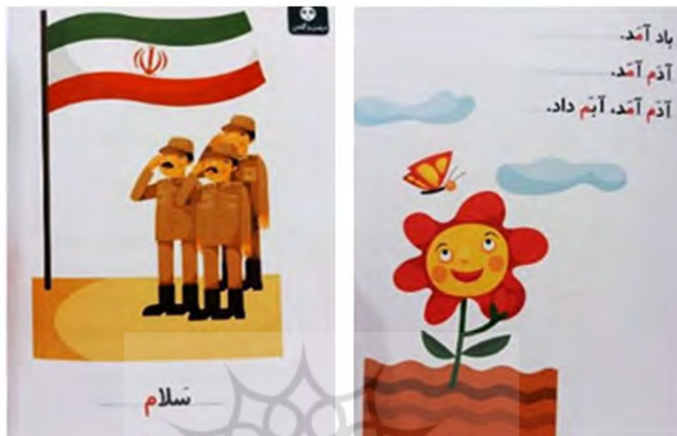
تصویر ۱۶. کتاب «مجموعه خودم می‌خوانم»، شکوه قاسم‌نیا و عبدالرحمن صفرپور، ۱۳۹۲، انتشارات افق (کتاب‌های فندق).

و او را درگیر کتاب و بازی می‌کند؛ مؤلفه‌های مورد بررسی نظیر بازی و تقویت رفتارهای رفت و برگشتی و تکرارشونده در آن‌ها دیده می‌شود.