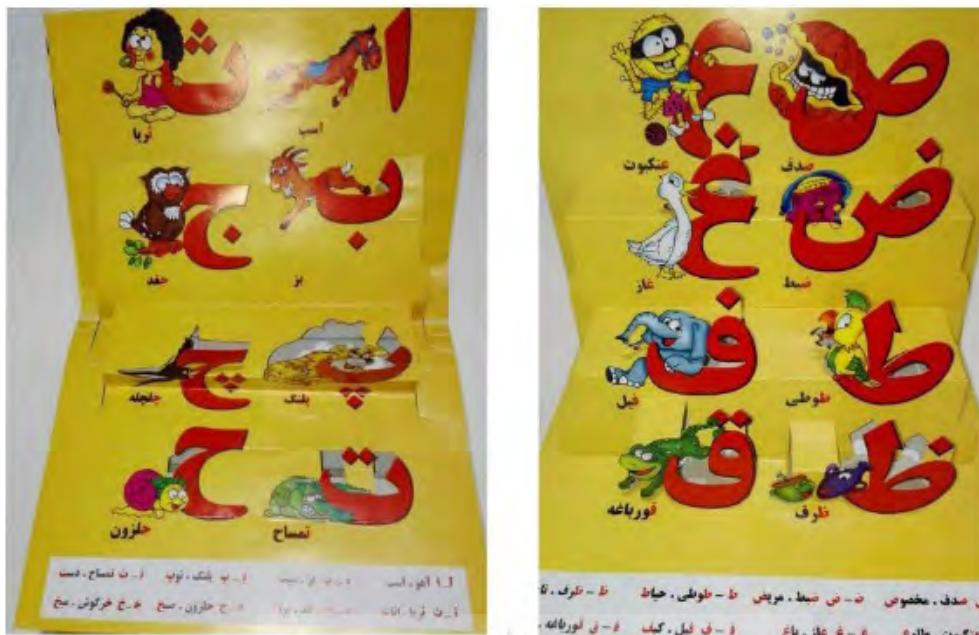
تصویر ۱۹. کتاب «الفبای من»، الف پناهی، ۱۳۸۱، انتشارات خانه هنر

در تصویرگری این کتاب متاسفانه از طراحی کارکترهای تکراری، دیجیتالی و با جذابیت پایین استفاده شده است. طراحی کارکترها، طراحی‌های مشابه با کارکترهای موجود در بازار و انیمیشن‌های غیرایرانی است و حتی در تعدادی از آن‌ها ضعف در طراحی و تناسب وجود دارد. رنگ زمینه و رنگ حروف الفبا بدون توجه به ترکیب رنگی کلی انتخاب شده است. فونت استفاده شده در این اثر از لحاظ فرم مناسب است، اما ضخامت زیادی دارد و شاید استفاده از فونتی با ضخامت متوسط برای کودک چشم‌نوازتر باشد. تنها نکته مثبت این اثر، تفاوت در نوع کتاب یعنی پاپ-آپ بودن آن است. پیازه معتقد است هوش فضایی شامل درک و یادآوری مکان‌های نسبی اشیا در ذهن است و اشیا را می‌توان از طریق چرخش یا تغییر فرم، دستکاری کرد «پیترسن و کالینز، ۱۳۸۱: ۶۲». این توانایی تجسم و تفکر فضایی در ذهن کودک است و این اثر به دلیل ویژگی‌هایی که داراست از لحاظ عینی و ملموس بودن تصاویر، کتابی موفق است و کودک را درگیر اکتشاف و تقویت هوش فضایی و آشنایی با بعد فضا، مکان و زمان می‌کند و مؤلفه‌های مورد بررسی بازی؛ تقویت رفتارهای رفت و برگشتی در این کتاب دیده می‌شود و اگر تصویرسازی مناسب با سن کودک و اجرای قوی در طراحی کارکترها، رنگ‌گذاری، صفحه‌آرایی و انتخاب درست فونت انجام می‌شد، بی‌شک جزو کتاب‌های جذاب و مؤثر برای کودک قرار می‌گرفت.