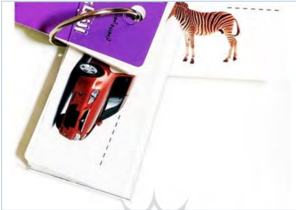
تصویر ۱۲. کتاب مجموعه کتاب‌های حلقه‌ای «آزمون و آموزش الفبای فارسی»، فریده افنانی، ۱۳۹۴، انتشارات دیپایه.