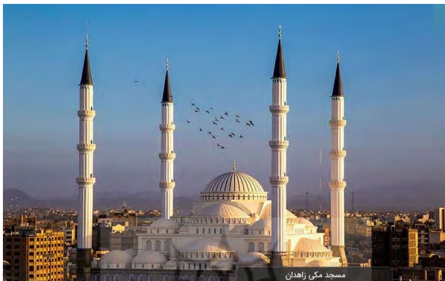
شکل ۱: نمایی از مسجد مکی زاهدان-قطب اهل سنت شرق کشور

عموما بازاری و تاجر این محله را برای سکونت انتخاب نمایند. که این موضوع موجب علاقه‌مندی محققان به بررسی شرایط این محله گردیده است.