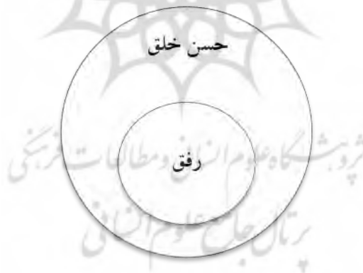
شکل ۲: رابطه رفق و حسن خلق

محور سوم. درباره مفهوم بالادستی رفق باید گفت که این که رفق را به عنوان یک سازه روان‌شناختی ثمره چه چیزی بدانیم، سؤالی است که پاسخ آن را به دو گونه متفاوت اندیشمندان اسلامی داده‌اند. برخی از آنان رفق را ثمره حسن خلق و برخی دیگر ثمره حلم دانسته‌اند که شاید بتوان گفت حلم از مصادیق حسن خلق است. ۲ البته با بررسی روایاتی که در باب رفق، حسن خلق و حلم وجود دارد، می‌توان به این جمع‌بندی رسید که مفهوم بالادستی رفق حسن خلق است؛ ۳ همان طور که برخی از پژوهشگران نیز در بررسی‌های خود این یافته را تأیید می‌کنند. ۴