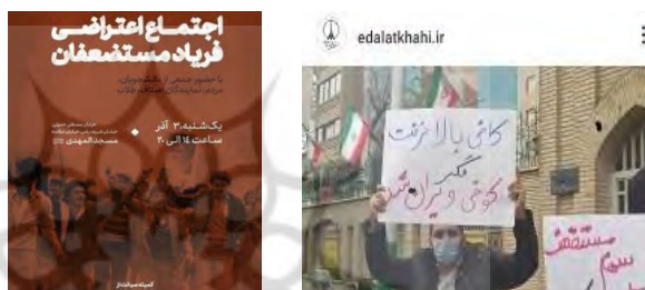
شکل شماره ۳: برجسته‌سازی عدالت طلبی

نگاه دولتی دهه ۶۰ خسارت بار بود؛ خصوصی‌سازی افسارگسیخته، بدون رعایت لوازمی نظیر شفافیت، نظارت، اهلیت و بخش‌های تأمین‌کننده منافع مستضعفین که در بندهای «ب»، «د» و «ه» ابلاغیه آمده بودند، نیز بحران‌زاست. لیکن آنچه تاکنون از نتایج حاصله‌ی خصوصی‌سازی دیدیم، لطمه به تولید ملی، تعمیق نابرابری و شکاف اقتصادی بوده است. انحراف فرآیند خصوصی‌سازی، ناشی از قدرت گرفتن جریان لیبرال در کشور و غلبه‌ی آنها بر مجاری تصمیم‌ساز است؛ که منجر شد تا اصل ۴۴ جای آنکه ذیل گفتمان اقتصاد مقاومتی (و مردمی کردن اقتصاد) طرح شود، در چارچوب تئوری‌های لیبرالی «دولت حداقلی» تعریف و اجرا شود. انتظار داریم با دستور شما یا قوه قضائیه، جلوی روند فعلی خصوصی‌سازی (تا زمان اصلاح این مدل) گرفته شود.»