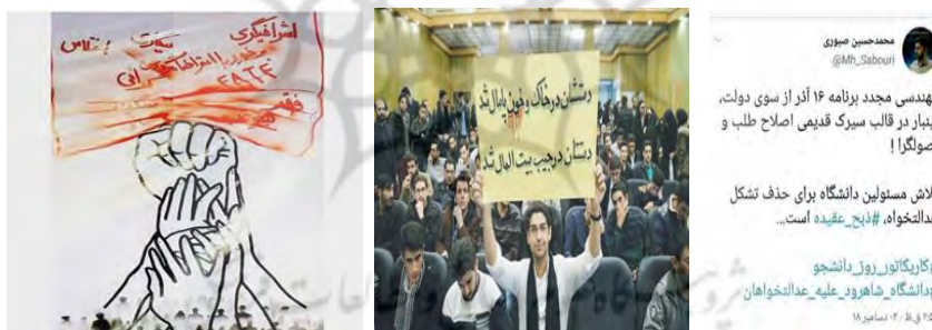
شکل شماره ۱: حاشیه رانی‌های آشکار

«قریب به ۱۰ سال پیش بود که در میان هیاهوی جنگ‌های سیاسی و دعوای اصولگرا و اصلاح طلب و در شرایطی که گفتمان غالب بر فضای سیاسی و رسانه‌ای کشور با دغدغه‌های مردم و به ویژه محرومین و مستضعفین فرسنگ‌ها فاصله داشت و در فضایی که تبعات توسعه اقتصادی تقلیدی از غرب و پس از آن توسعه سیاسی ناموزون آثار خود را بر فضای کشور بر جای گذاشته بود، طیفی از دانشجویان و جوانان که مبتنی بر آرمان‌های انقلاب اسلامی نگاهی انتقادی نسبت به اوضاع جاری کشور و عملکرد قوای مختلف داشتند، با مرور سخنان امام خمینی (ره) و رهبر انقلاب، خط مبارزه بی‌امان با فقر و فساد و تبعیض را که رهبری طی دو پیام به سران قوا و جنبش دانشجویی ابلاغ نمودند پی گرفتند و با سردادن شعارهایی چون مبارزه با مفاسد اقتصادی، لزوم توجه به محرومین و مستضعفین در برنامه‌ریزی‌ها و سیاست‌گذاری‌ها، لزوم مقابله با ویژه‌خواری‌ها، ضرورت آسیب‌شناسی مسیر حرکت نظام جمهوری اسلامی و امثالهم و اقدام عملی و اجتماعی منطبق با این اصول و شعارها، جریانی را شکل دادند که تحت عنوان «جریان عدالت خواهی» شناخته شد.» (کانال تلگرامی جنبش عدالتخواه).