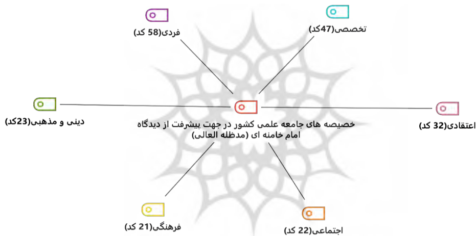
شکل (۱) نقشه پیوند بین یافته‌های حاصل از تجزیه و تحلیل داده‌ها

کدگذاری خصیصه‌های جامعه علمی کشور در جهت پیشرفت از دیدگاه امام خامنه‌ای (مدظله العالی)