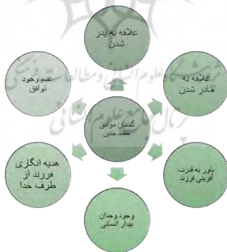
شکل ۲: ویژگی‌های گفتمان موافق حفظ جنین

و ناراحتی از خیانت همسرش ندهد، فقط علاقه به مادر شدن در او بود. علاقه به مادری را می‌توان در دسته ویژگی‌های فطری و وجودی هر زنی دانست که در صورت دست نیافتن به آن، می‌تواند یک زندگی حسرت‌باری را برای آن زن به ارمغان بیاورد. این علت را همچنین می‌توان در قصه پنجم یعنی قصه بهار صحیح دانست. بهار که یک عمر در حسرت مادر شدن بود، وقتی از بارداری خودآگاه شد، دیگر سر از پا نشناخته و علی‌رغم اینکه شوهرش منصور، تمام تلاش خود را برای متقاعد ساختن او برای انجام سقط به کار گرفت، ولی این غریزه مادری بود که حاضر نشد پاره تن خود را از خودش جدا کند. در نتیجه، در داستان‌های افسانه و بهار، هیچ دلیلی محکم‌تر از عشق و علاقه به مادر شدن وجود ندارد تا در مقابل عواملی که آن‌ها را به سقط سوق می‌دهند، ایستادگی کرده و طعم مادری را بچشند. به صورت کلی می‌توان گفتمان موافق حفظ جنین را در شکل پایین به تصویر کشید: